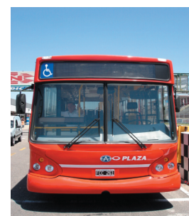
TATSA PUMA D 12 Línea 129 (Plaza)