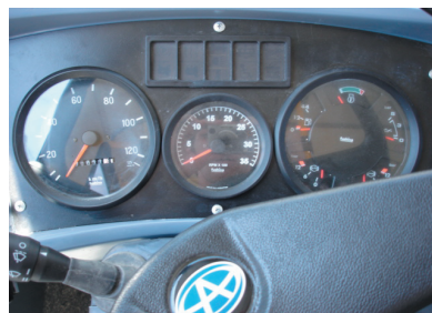
TATSA PUMA D 10.5 Línea 15 (Sur-Nor)