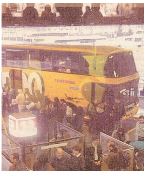
La marca de carrocerías volvería a producir en el país.

La carrocera Marcopolo -de origen Brasileño- se instaló en la Provincia de Córdoba hacia fines de la décadas del '90. Pero la crisis desatada en diciembre de 2001 motivó la suspensión y luego el despido de la gente, cerrandolas persianas en marzo de 2002.