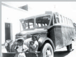
El Copacabanita, Primer colectivo de la línea Rojos

Es el término que se utiliza en Bolivia para denominar al transporte público de pasajeros, más conocido como "Colectivo"