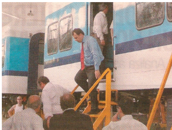
Sergio Cabral, visitó las instalaciones de TATSA en San Martín

Durante su recorrida por las instalaciones de TATSA -donde se fabrica el chasis y la carrocería de los ómnibus de piso bajo modelos Puma D10.5 y D12-, Cabral manifestó su interés en mejorar el autotransporte público de pasajeros de Río de Janeiro.