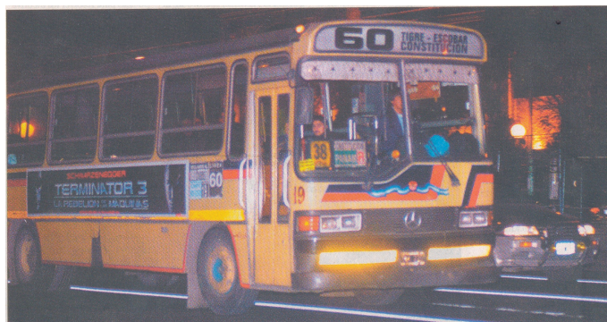
La empresa MONSA, operadora de la línea 60, celebró 75 años de permanencia en el servicio público del autotransporte

En esa reunión organizada en el predio de la Rural se destacó que, pese a los inconvenientes que afrontan las empresas, se fue registrando una progresiva mejora tecnológica del parque rodante, como las unidades piso bajo para uso de discapacitados y personas de edad avanzada, los limitadores de velocidad, lectores de monedas y existencia del motor en la parte de las unidades, que disminuyó la eventual agresividad de marcha y la emisión de gases y el calor que en años anteriores afectaba a los choferes.