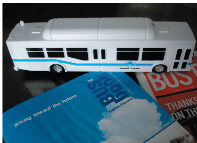
Una maqueta de los buses y su magazine.

La Agencia posee 6 tiendas (Foothill Transit Store) equipadas con expertos en el servicio al cliente, que lo pueden asesorar en su viaje.