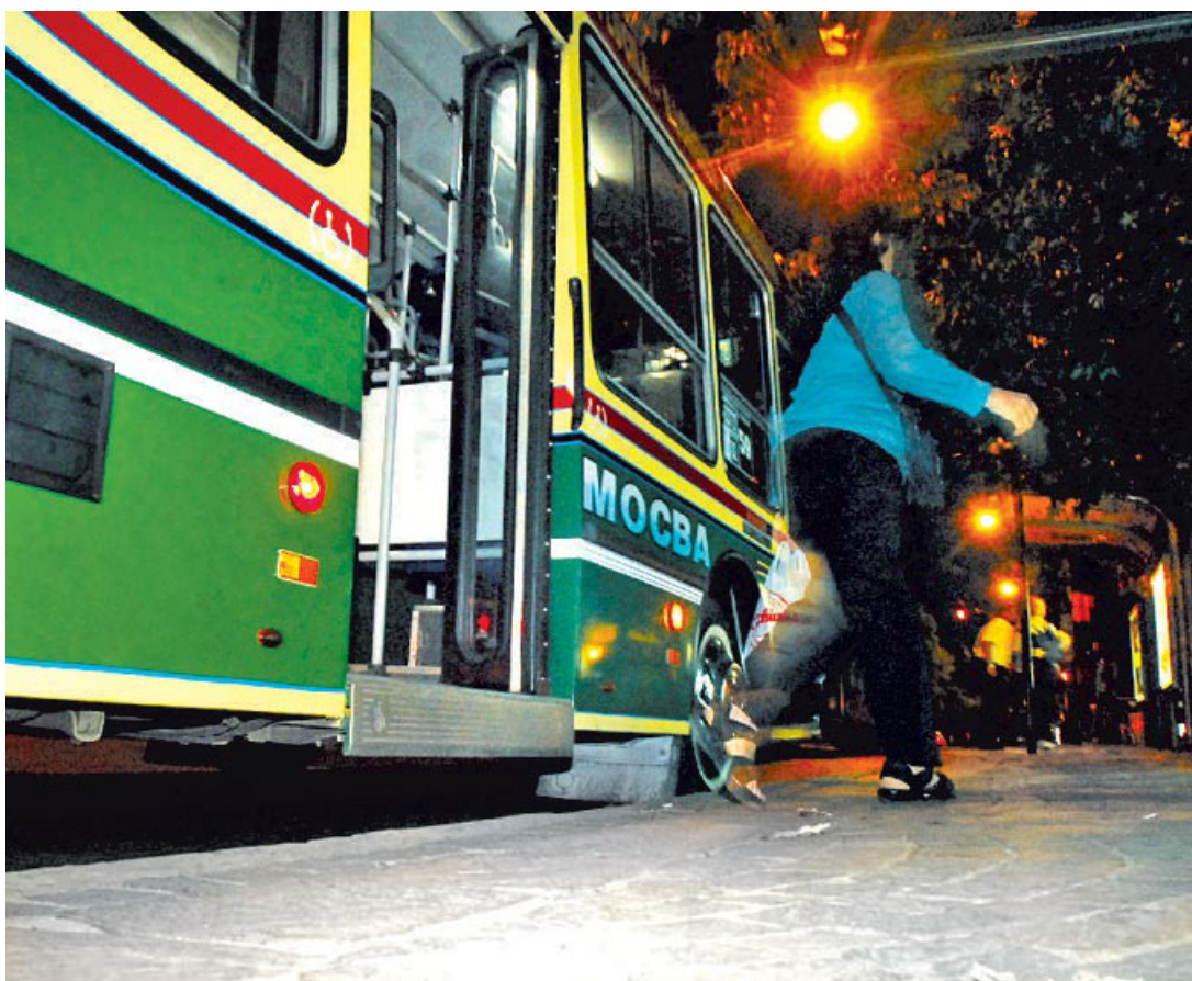
DE NOCHE. Un pasajera desciende ,ayer, en una parada de Barracas. Quieren que puedan hacerlo en cualquier parte.