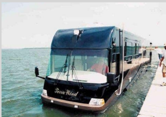
Un Bus acuático