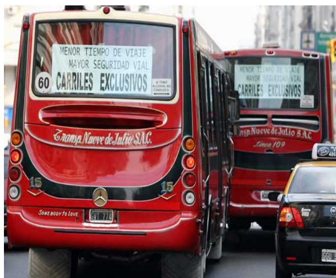
Carteles de protesta colocados en los colectivos. Algunos con ironía y otros comparan al Subte.