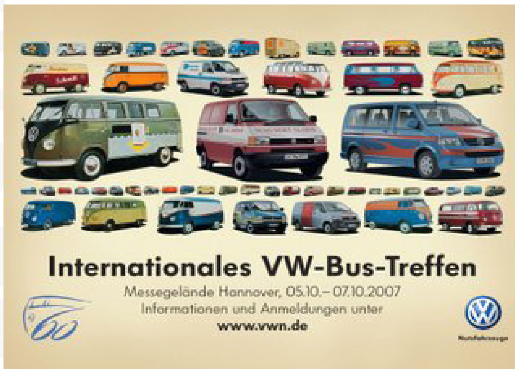
POSTER DE LA FIESTA. Habrá un modelo representante de cada época

Que hoy sea el único vehículo que se fabrica desde hace 6 décadas es la excusa perfecta para hacerle un homenaje en vida podríamos llamarlo así, ya que aún hoy se produce en la planta que Volkswagen tiene en Brasil.