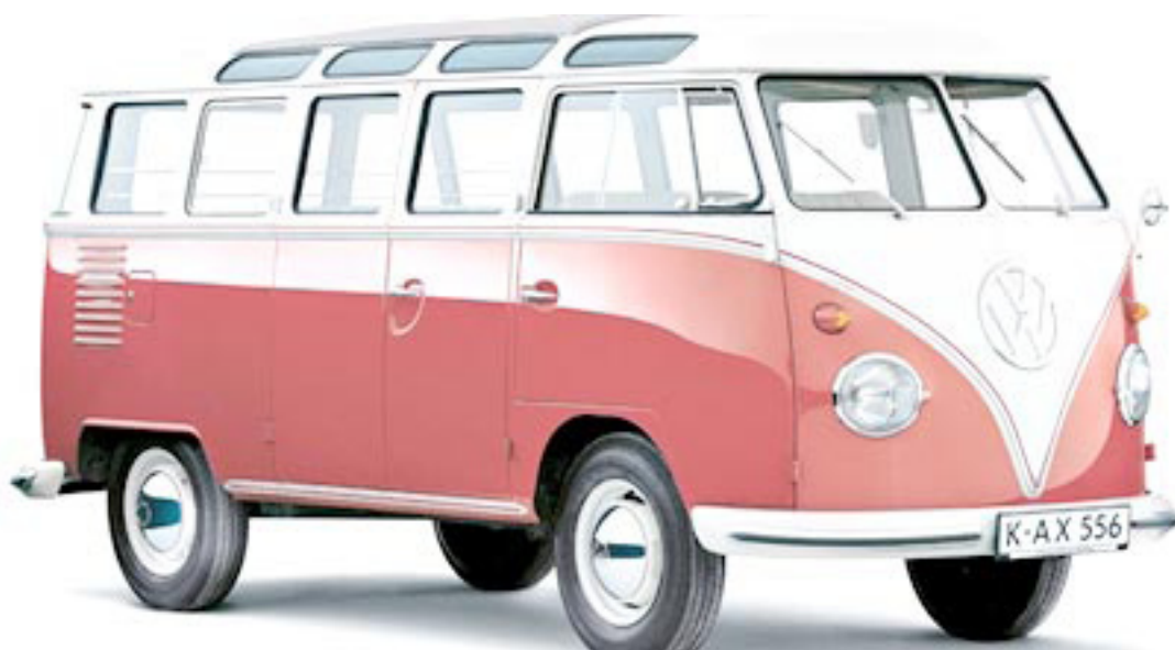
DESDE 1947. La Kombi se resiste al paso del tiempo y aun se fabrica.

"Pocos autos provocan tantas emociones como esta furgoneta. Esto es un verdadero modelo de culto y ha significado la diversión y la independencia, así como el éxito de negocio. Por eso hemos organizado para octubre la celebración para la Kombi, pero también para toda la herencia incomparable de furgonetas de VW", explica Stephan Schaller de Volkswagen Commercial Vehicles en Alemania.