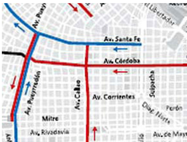
El Gobierno porteño propone extender los carriles ya existentes en las avenidas Córdoba, Entre Ríos-Callao y Pueyrredón-Jujuy. Por allí podrán circular colectivos y taxis ocupados.

* También se estudia disponer carriles sólo para colectivos.