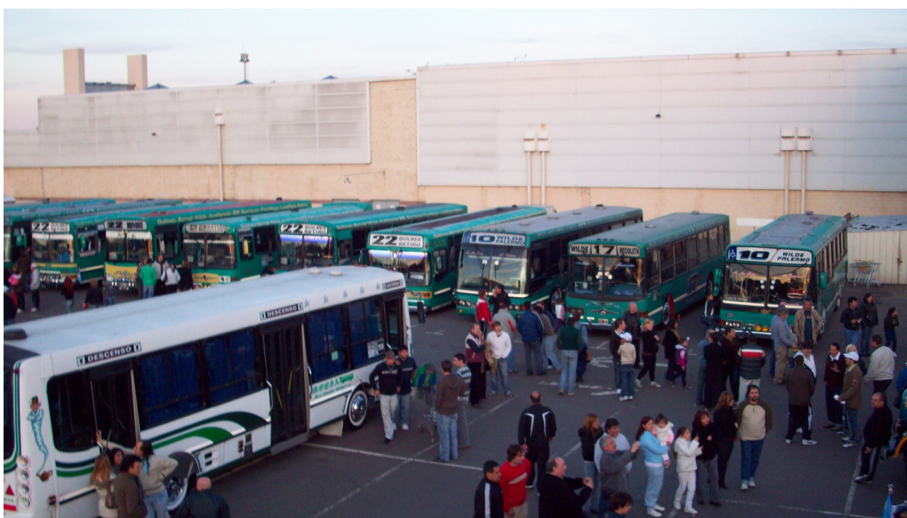
Algunas de las vistas de la 5ª Exposición de Bondis Especiales