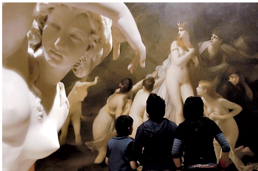
Entre la gente. los chicos, embelesados con el arte de los museos.

Para la edición 2009 suman sus aportes los partidos del conurbano de Maipú y Vicente López y las provincias de Catamarca y San Luis. Del mismo modo, los museos de Madrid harán una muestra al aire libre en Puerto Madero del Paseo del Arte, uno de los espacios de mayor concentración de riqueza artística del mundo. Y además, por primera vez, el evento compartirá fecha y actividades con la ciudad de Río de Janeiro.