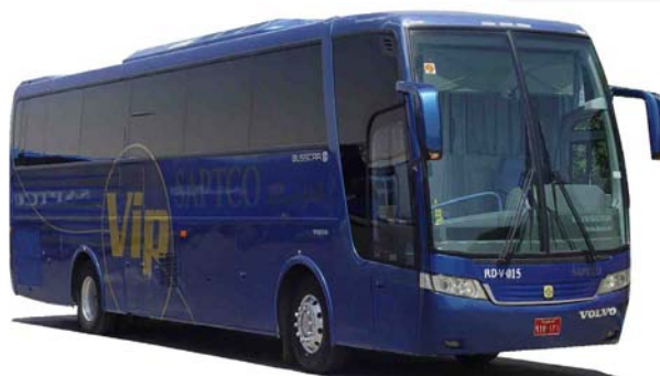
Volvo VIP (V15)