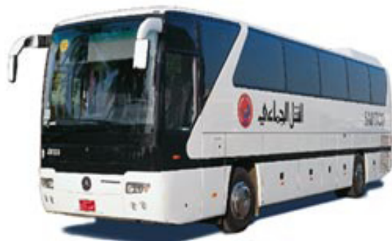
Mercedes 350 Turismo MBT