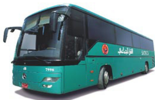
Mercedes 0560 RHD