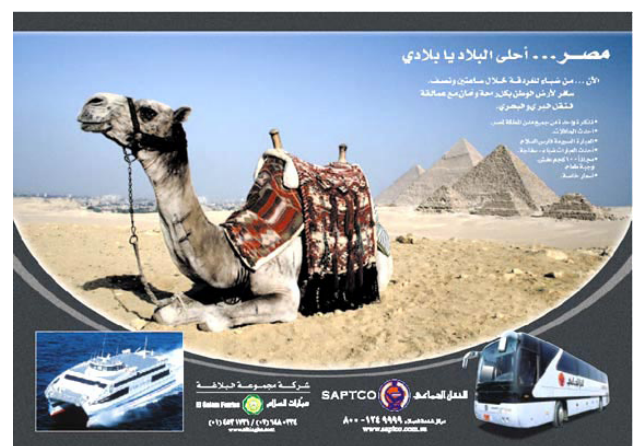
Publicidades de la empresa promocionando viajes a Sudán y Egipto