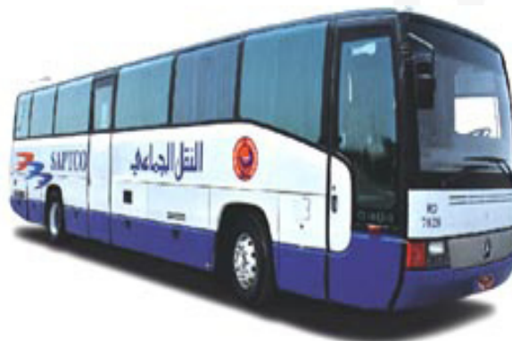
Mercedes 404 RHL