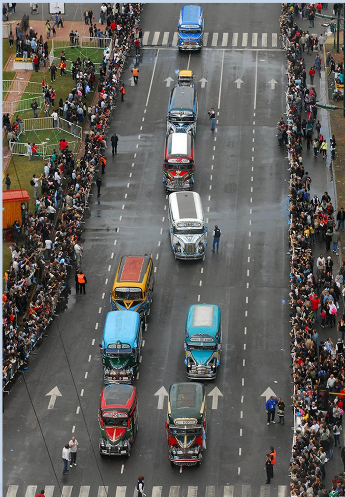
DESFILE HISTÓRICO - 24 de Mayo de 2010 - Avenida 9 de Julio - Obelisco.