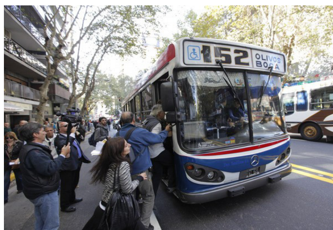
El primer colectivo que dobló en los contracarriles fue el coche 30 de la Línea 152.