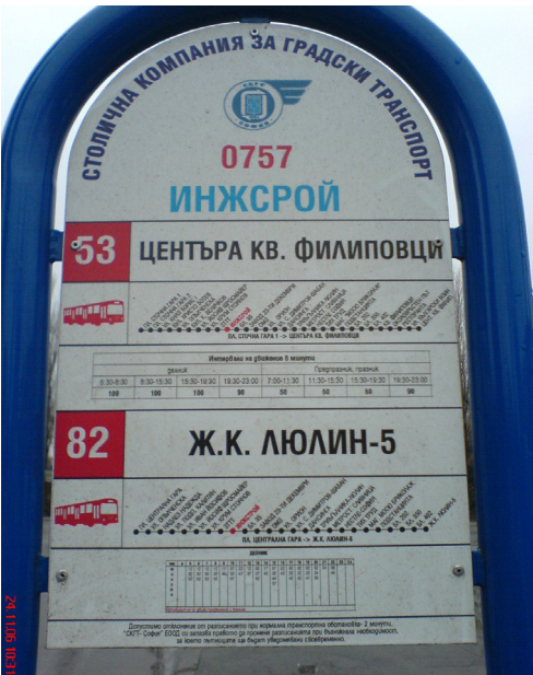
Una de las paradas de autobuses en Bulgaria. El recorrido de los mismos se encuentran diseñados como los planos de subtes.