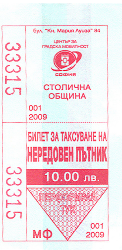
Los boletos (tickets) tienen diseños y colores diferentes dependiendo de la cantidad de viajes y el tipo de servicio que uno adquiere. También se puede optar por obtener una Tarjeta prepaga que es posible recargarla en estaciones y puntos de transferencia.

Esperamos que les haya interesado la investigación. En el próximo número seguiremos “Viajando por el Mundo” en busca de un destino diferente.