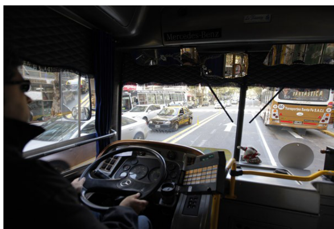
Circulando por los nuevos contracarriles abordo de un colectivo de la Línea 68.