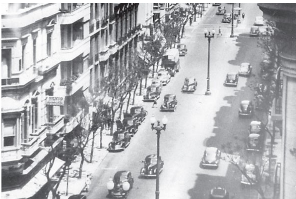
La Avenida Santa Fe, doble mano, en la década del 40.

Los carriles que se inauguraron son para todo tipo de vehículos, aunque fueron diseñados con la intención principal de absorber el paso de las líneas de colectivos que originalmente circulaban por Güemes, Charcas y Marcelo T. de Alvear.