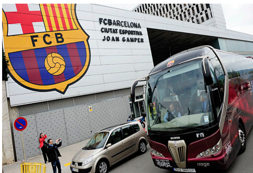
En un micro Scania se trasladaron los jugadores del Barcelona.

Los de Pep Guardiola, que esta mañana se entrenaron en la ciudad deportiva de Sant Joan Despí, con la ausencia destacada de Lionel Messi, partieron desde Barcelona rumbo a Milán a las 15 horas (10 de la Argentina), informó a Télam una fuente del club catalán.