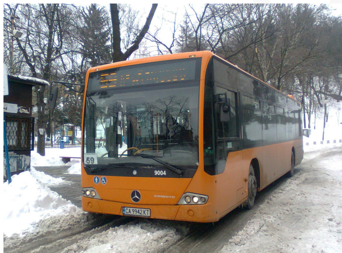
Mercedes Benz Conecto realizando el recorrido de la Línea 59 El número de coche es el 9004