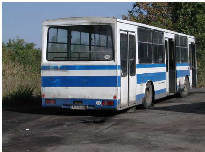
El modelo Chavdar B13-20 es también conocido como "Aquarium" ya que posee amplias ventanillas.