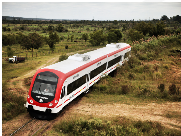
CONTRASTE. La moderna formación Materfer circulando por la antigua Estación Concordia Central y los campos.

Cada cabina posee un asiento para el conductor y otro para el acompañante. En el pupitre principal se destacan, entre otros, la palanca de aceleración, la de freno, los comandos de iluminación, la selectora de la caja de velocidades (que transmite los cambios de forma automática) y una pantalla táctil (o "touch screen") de 10,5 pulgadas. En ella se muestran, a pedido del conductor, el velocímetro, el consumo y nivel de combustible, el tacómetro, el porcentaje de aceleración, la presión de aceite, la temperatura del líquido refrigerante, la posición del freno y la tensión de las baterías principales. Para ver hacia atrás en las estaciones (o durante el viaje, si se desea), se montaron cámaras sobre las puertas de la cabina, que transmiten las imágenes a una pantalla del tablero de instrumentos.