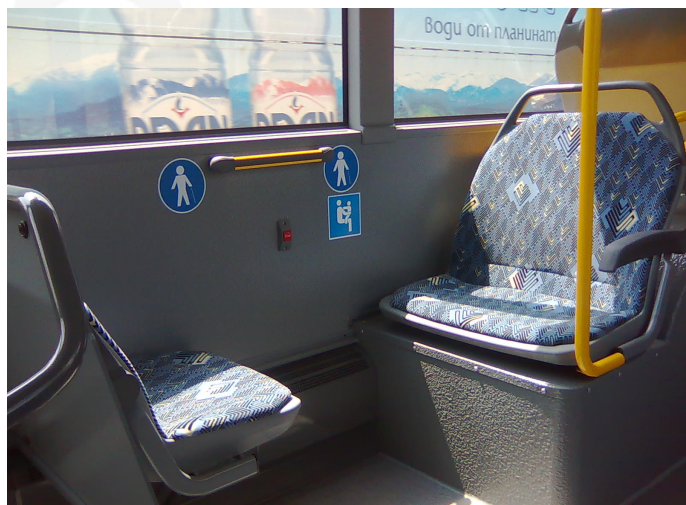
Los primeros asientos de cada unidad se encuentran reservados para personas con movilidad reducida y bebés y niños.