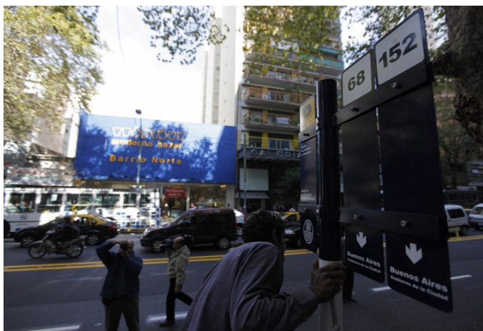
Las nuevas paradas sobre la vereda del contracarril.

Desde entonces, los colectivos que antes circulaban por Uriarte (las líneas 29, 34, 57 y 194) lo hacen por Darregueyra.