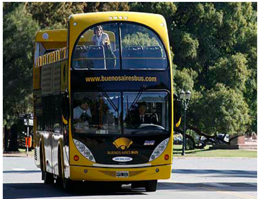
El Gobierno porteño y la empresa Buenos Aires Bus regalarán 700 entradas al público para que recorran el sábado 24 de abril los lugares más emblemáticos de la Ciudad de Buenos Aires.

En esta especial conmemoración, el servicio regular del Bus Turístico quedará suspendido por toda la jornada.