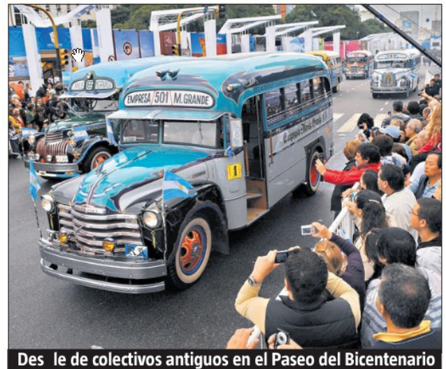
Desfile de colectivos antiguos en el Paseo del Bicentenario