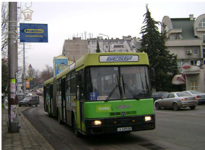
Chavdar 141 realizando el recorrido de la Línea 211

A continuación les presentamos algunas unidades de su extensa y variada flota de autobuses