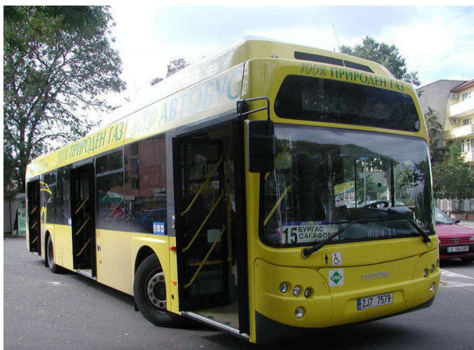
Tedom Kronos 123G realizando el recorrido de la Línea 15, que une la ciudad de Sarafovo con el Aeropuerto de Burgas. El Número de coche es el 271