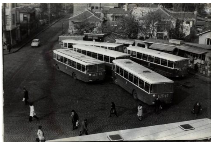
Plaza de la Comuna de París. Año 1974

Los tranvías 1 y 7 pasan por la avenida de Vítosha y unen las partes norte y sur de la ciudad. El número 5 también va del centro al barrio sureño de Kniájevo. Los tranvías 3, 6, 20 y 22 pasan de este a oeste.