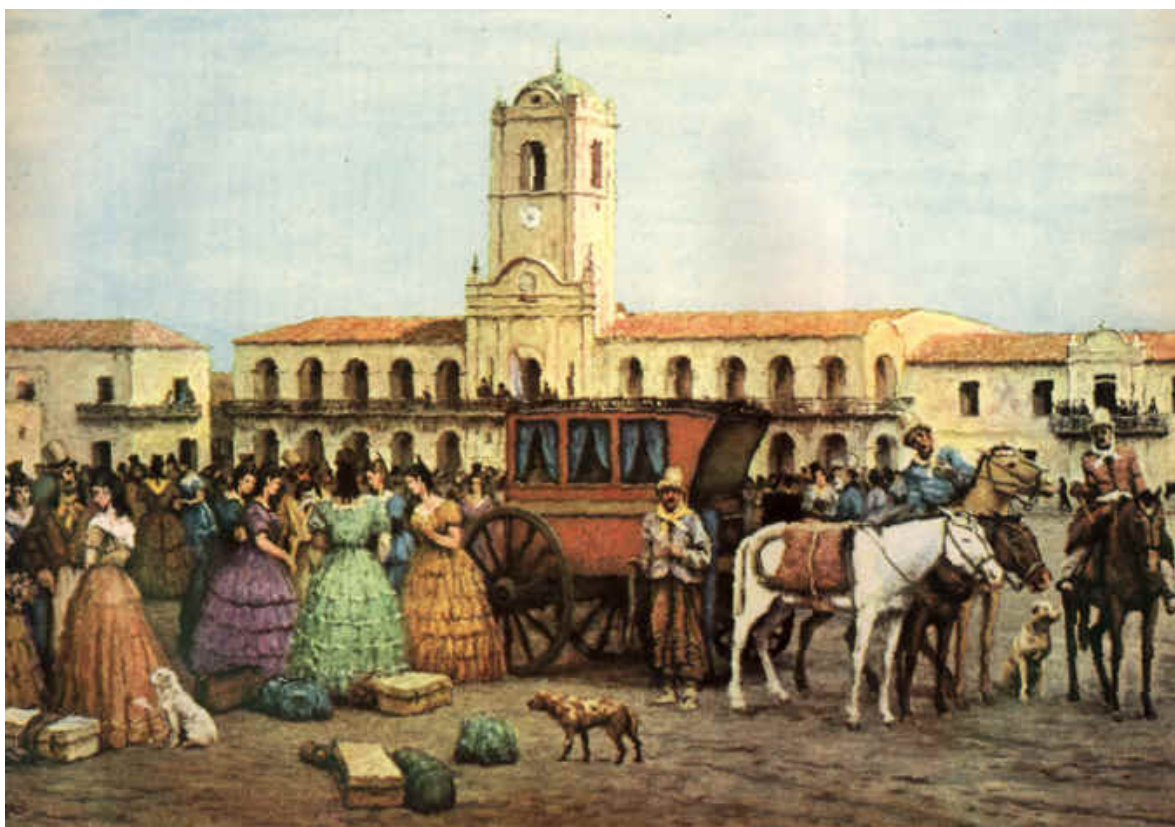
El Cabildo en plena Revolución de Mayo. Las diligencias y carretas eran comunes como medio de transporte de personas con alto poder adquisitivo.

La llamada Revolución de Mayo fue un proceso histórico que resultó en la ruptura de los lazos coloniales con España en 1810 y habilitó el camino hacia la independencia del país, el 9 de julio de 1816. Los hechos de Mayo no hicieron más que cristalizar un movimiento liberador que venía buscando, desde 1806, mayor participación política y económica de los criollos. Así, el 22 de mayo de 1810, luego de que llegara la noticia de la caída de la corona española en manos de franceses, los criollos convocaron a un Cabildo Abierto que tuvo que ser aceptado por el Virrey Cisneros, representante de España en el país.