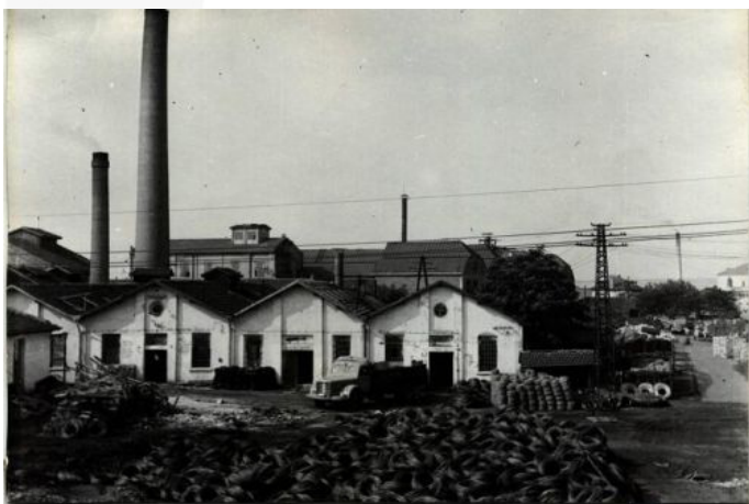
Garaje de Burgas. Año 1959

En Sofía y en las principales ciudades circulan tranvías, autobuses y trolebuses con un precio único por trayecto sin depender de la distancia. Generalmente comienzan a funcionar a las 4.00 de la mañana hasta las 01.00 h. La mayoría de las líneas se anuncian con números por lo que es necesario preguntar previamente sobre el recorrido. Los boletos deben adquirirse con anticipación en los quioscos especiales y se validan en el momento de abordar. Si se piensa permanecer algunos días en Sofía, es recomendable hacerse de un bono especial, válido para cinco días.