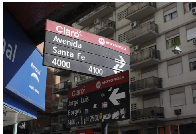
La calle Borges cambia su sentido de circulación entre Güemes y Av. Santa Fé y esta última agrega un sentido (Contracarril).

Folleto que reparte el Gobierno de la Ciudad a los vecinos de la zona para informar acerca de los cambios realizados en el tránsito.