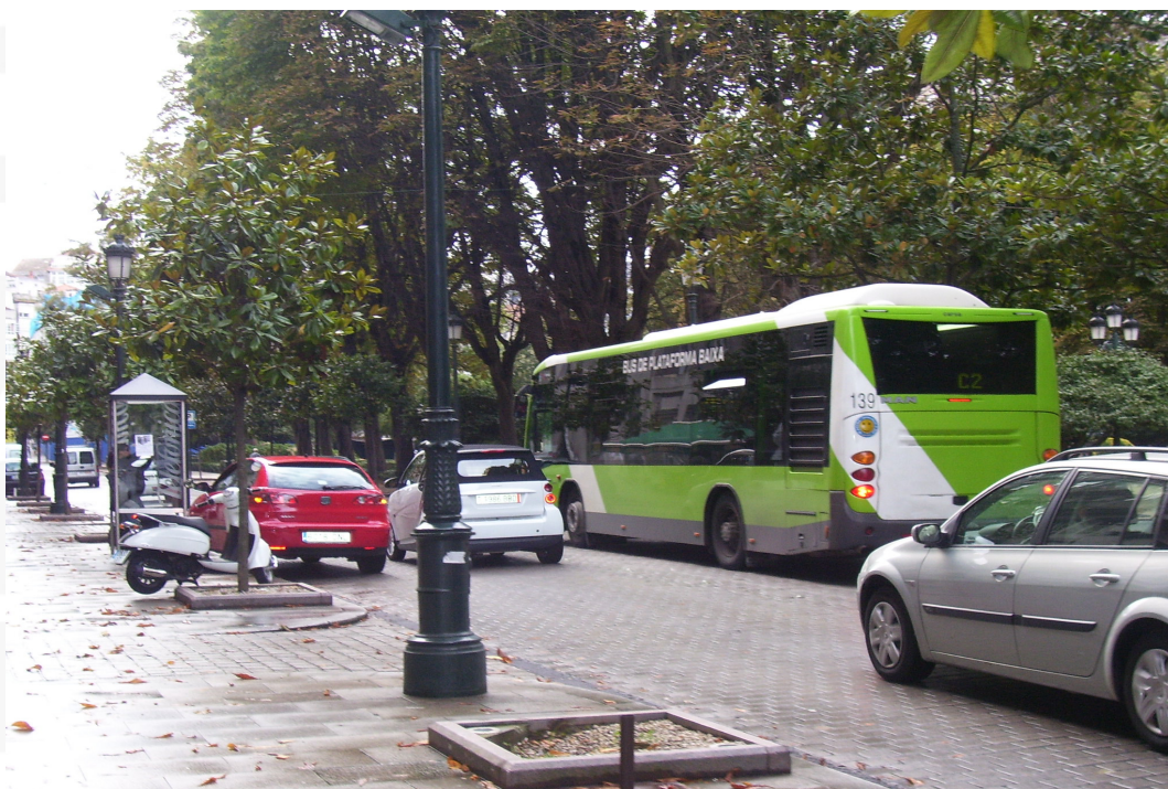
Circulando por las calles españolas, el coche N°139 carrozado por MAN en su versión CS 40 Magnum de "plataforma baja". La unidad pertenece a la empresa Vitrasa."

La ciudad española se ubica dentro del municipio de Galicia, en el suroeste de la provincia de Pontevedra, no muy lejos del límite de este país con Portugal. Tiene salida a la Ría de Vigo y a través de ella al Océano Atlántico. Como curiosidad Vigo es la ciudad más poblada del municipio aún sin ser capital de la provincia ni tener actividad administrativa, lo que demuestra la importancia de su puerto.