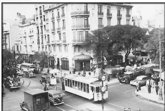
Tranvías de Ayer...

Hoy, los voluntarios que mantienen este servicio turístico -gratuito para todos los que deseen subirse a dar un paseo- están de festejo. El viejo tranvía porteño fue distinguido por la revista internacional "Tramways and Urban Transit", que en su edición de febrero 2010, reseña los desarrollos tranviarios y lo destaca como uno de los "12 hitos fundamentales" ocurridos en los últimos 30 años alrededor del mundo. La alegría es aún mayor si se piensa que este emprendimiento, que se sostiene por el trabajo ad honorem de los miembros de la "Asociación de Amigos del Tranvía", comparte el podio con inversiones multimillonarias y sistemas supermodernos de todo el planeta.