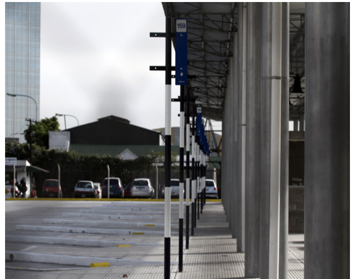
Vistas de la Nueva Terminal. Funcionará en la esquina de la avenida Madero y Cecilia Grierson. Las líneas de colectivo 105, 74, 159, 146, 109, 180, 140 y 99 la tendrán como nueva parada.

Por esa razón, en los próximos días las líneas de colectivo 105, 74, 159, 146, 109, 180, 140 y 99 tendrán como parada la estación de Madero y Grierson (continuación de la avenida Córdoba), donde se construyó una plataforma para pasajeros que está protegida con un techo y que también contará con baños para los choferes, bancos y luminarias. El predio también está cercado, lo que evitará que los pasajeros se crucen entre los colectivos; sólo podrán ingresar por el andén habilitado.