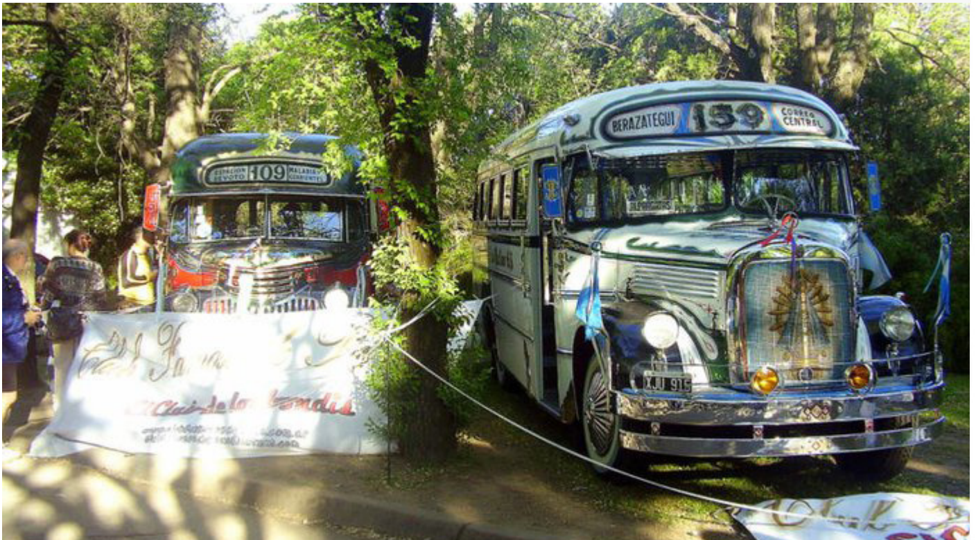
DOS RELIQUIAS. Un Chevrolet perteneciente a la Línea 109 y un Mercedes Benz de la Línea 159.

Se destacan los clubs de autos que agrupados por marca exhiben sus modelos más destacados, estando inclusive presente el club de los Bondis con dos ejemplares.