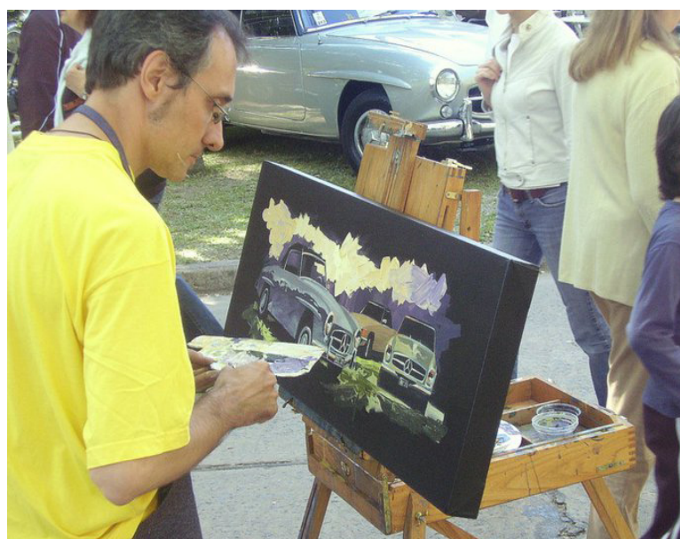
AutoClásica también es un espacio para el "arte sobre ruedas"