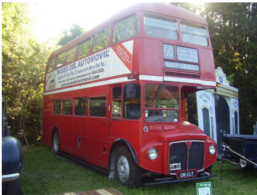
El famoso "Double Decker" que posee el Museo del Automóvil