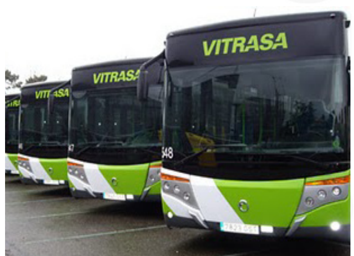
Los nuevos autobuses de la empresa Vitrassa

Debido a las cláusulas de la concesión para la explotación del servicio, Vitrassa no puede aumentar el número de su flota dedicada al transporte urbano de pasajeros, salvo que el Ayuntamiento cambie las condiciones de dicha concesión.