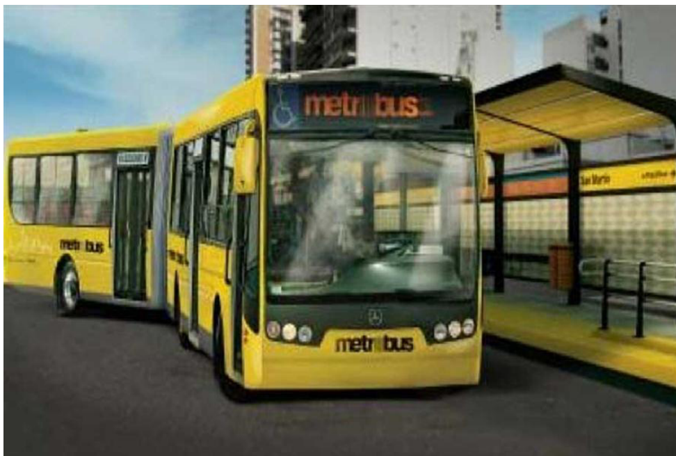
Colectivos Articulados circularán por las vías centrales preferenciales

El nuevo sistema contará, además, con un cronograma de horarios preestablecidos y tecnología de posicionamiento satelital (GPS), que permitiría conocer a los pasajeros el tiempo de espera para el siguiente colectivo.