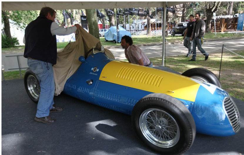
Seis automóviles del piloto argentino más grande de todos los tiempos estarán al alcance del público.

Esta undécima edición se podrán apreciar un total de 920 vehículos, un número récord para este evento que precisa siete meses de ardua preparación y que nació a raíz de reuniones que mantenían un grupo de amigos íntimos en la casa quinta de uno de ellos. Más de una década después se estima una convocatoria de alrededor de 40.000 personas, y no les espera cualquier cosa. Los organizadores exigen que se cumplan los siguientes requisitos: que el coche cuente con por lo menos 30 años de antigüedad, que no sea de uso diario del dueño y que éste lo pueda entrar al predio sin ningún tipo de asistencia.