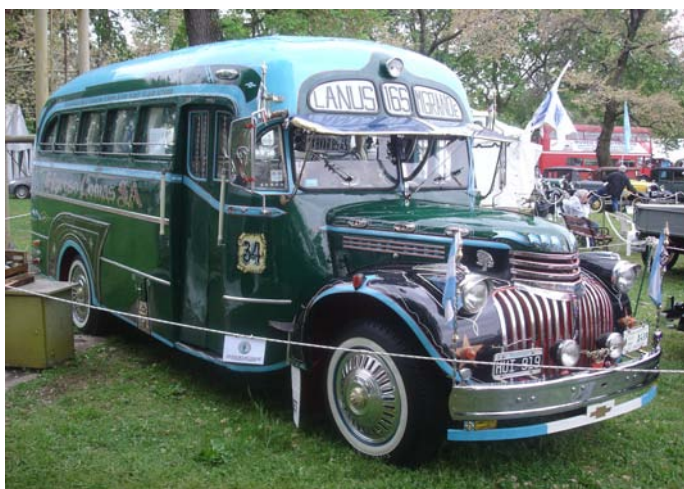
Línea 165, Chevrolet (1946) Presentado por el "Club de Automoviles Clasicos de Esteban Echeverria"