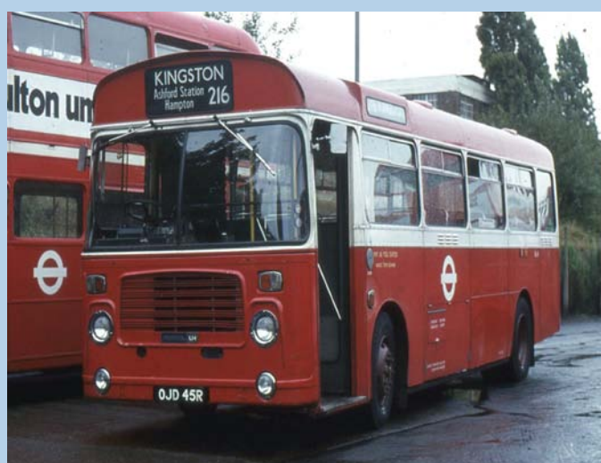
London Transport . BL45 OJD45R . Cromwell Road , Kingston . 18-Septiembre-1981

http://www.flickr.com/photos/big_john_bus_spoter/6477282177