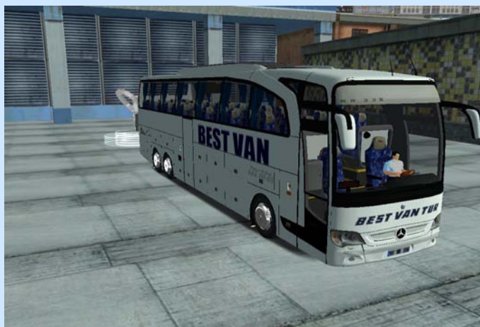
Mercedes Benz 3D para Videojuegos

http://www.facebook.com/groups/136624553104544