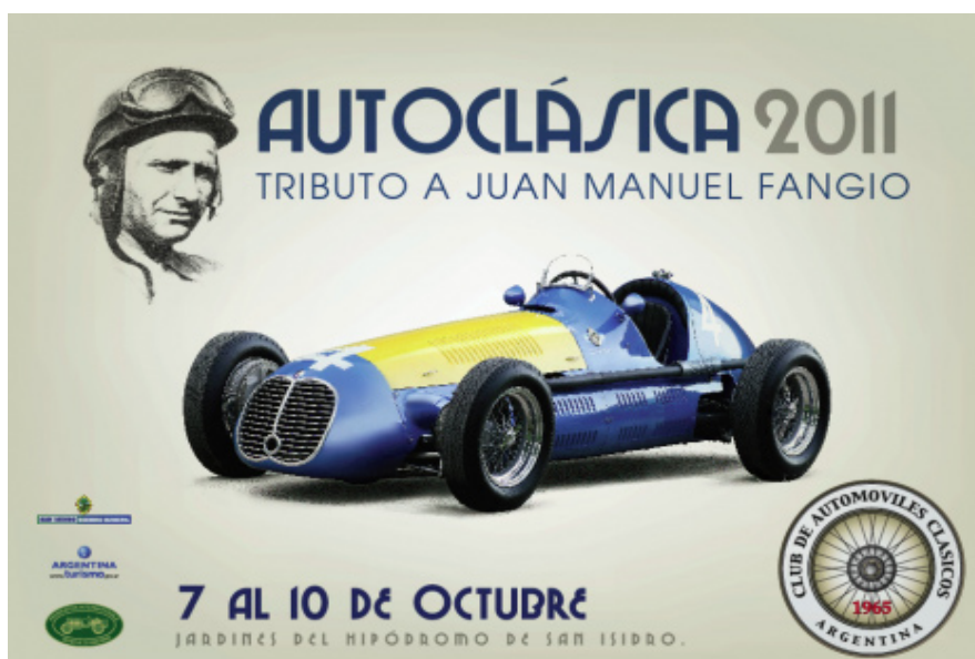
La gráfica promocional del evento de este año homenajeando a Juan Manuel Fangio a los 100 años de su nacimiento.

En el marco del centenario del nacimiento de Juan Manuel Fangio, Autoclásica, la mayor exposición de automóviles y motos antiguos de América del Sur, rinde tributo al quintuple campeón del mundo. Durante el fin de semana largo, en el Hipódromo de San Isidro -desde hoy y hasta el lunes, entre las 10 y las 18.30-, los amantes del automovilismo podrán repasar la carrera del mítico piloto a través de los autos que corrió en los circuitos más importantes del mundo.