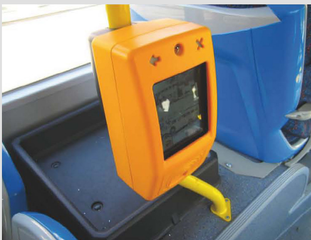
El sistema prepago en el transporte Croata

Curiosidad: Ya se encontraba instalado antes que comience en SUBE en Argentina.