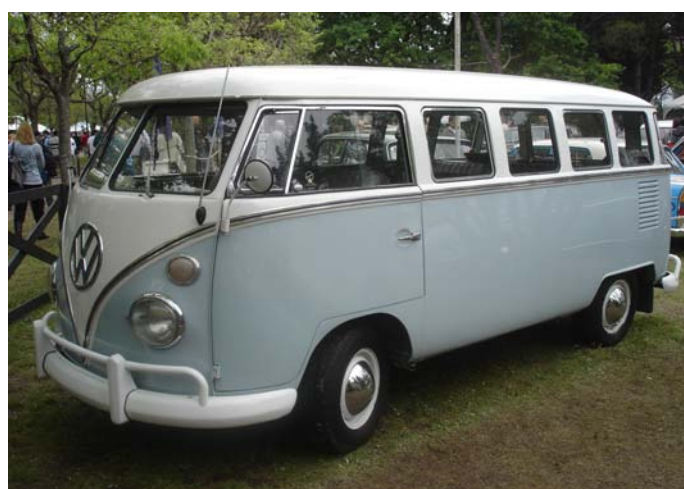
Las Volkswagen Bus dijeron presentes en stands de Clubes de Volkswagen

AUTOJUMBLE: Más de 80 puestos presentaron repuestos, objetos antiguos y todo lo que un fanático y coleccionista desea tener.