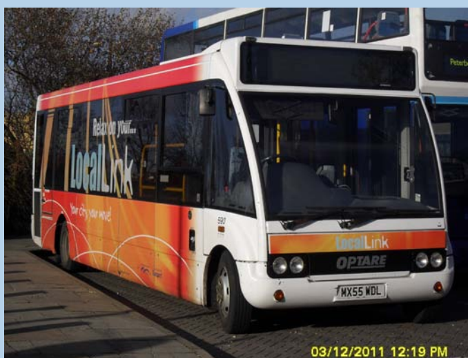
Chesterfield Transport Leyland Panther ENU93H 93