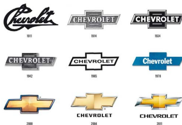
Evolución del logo de Chevrolet a lo largo del tiempo.

En los últimos años, Chevrolet ha ido más allá de sus mercados tradicionales en Norteamérica y Sudamérica y hoy, su lista de 10 mercados principales incluye a China, Rusia, Uzbekistán e India.