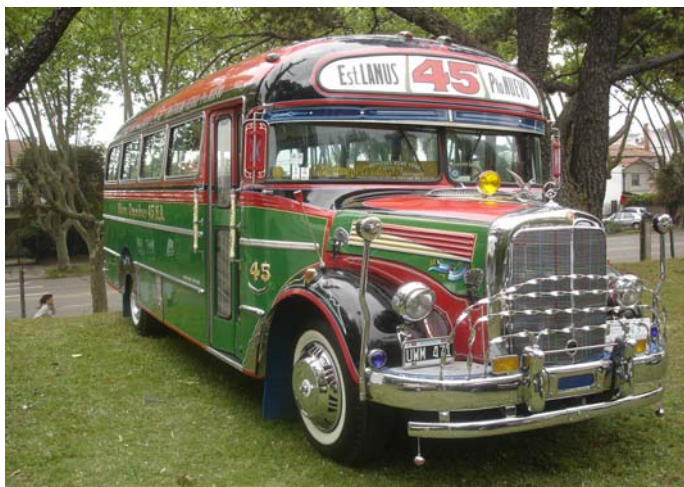
Línea 45, Mercedes Benz 312 Carrozado por ALA (1962) presentado por el Club "Mercedes Benz"