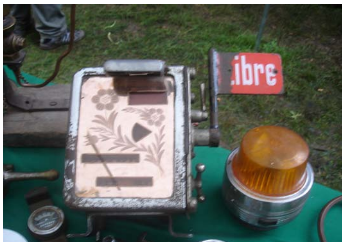
Un viejo Reloj Taxímetro