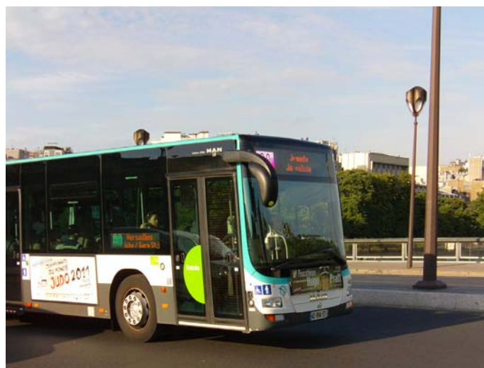
Modernos MAN "Lion City" recorren las calles de París

Al invertir en estos medios de transporte para reducir el tiempo de traslado de las personas hace que el uso de colectivos o autobuses no sea tan masivo como lo es en la Argentina. Sin embargo, con el amplio recorrido que alcanza la red de 59 líneas, el bus se transforma en una buena opción para los turistas que quieren disfrutar de las extraordinarias vistas que tiene la "Ciudad de la Luz".