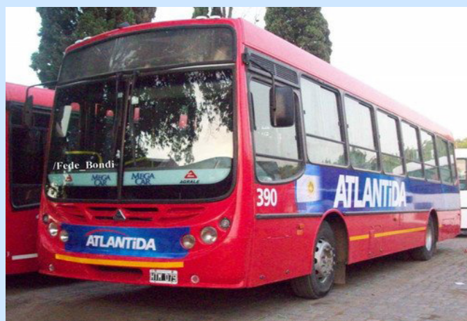
Agrale MA 15 - Atlántida

http://www.facebook.com/groups/136624553104544