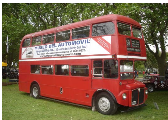
Leyland Double Decker presentado por el "Museo del Automóvil"