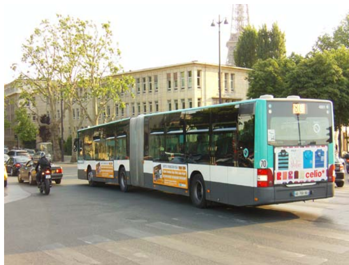
Los colectivos articulados ya forman parte de la geografía parisina.

Cuando Bertrand Delanoë fue elegido alcalde en el 2001 inició un plan para mejorar la infraestructura de los transportes urbanos. Las grandes inversiones hicieron que el metro o RATP (Red de Transporte Público de París), o como nosotros los llamamos, el subte, sea el medio predilecto para recorrer la ciudad en poco tiempo siempre y cuando se elija la combinación correcta entre las 16 líneas que conectan 380 estaciones. No hay un solo sitio turístico que no tenga una salida de metro en las proximidades.