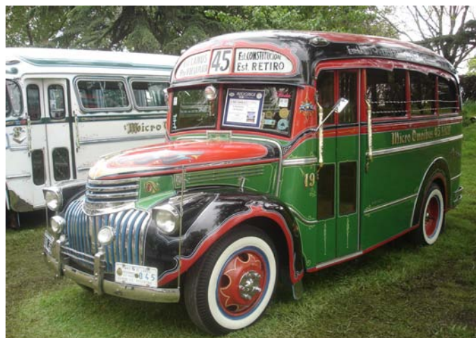
Chevrolet Carrozado por "el Trebol (1945) presentado por el "Club Famosos de Bs As"