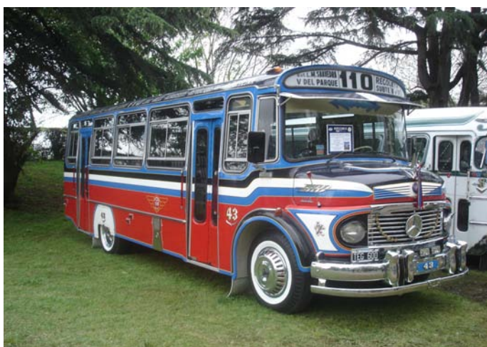
Línea 110, Mercedes Benz 1114 Carrozado por El Cóndor (1982) y Mercedes Benz 312 (1961) presentados por el "Club Famosos de Bs As"