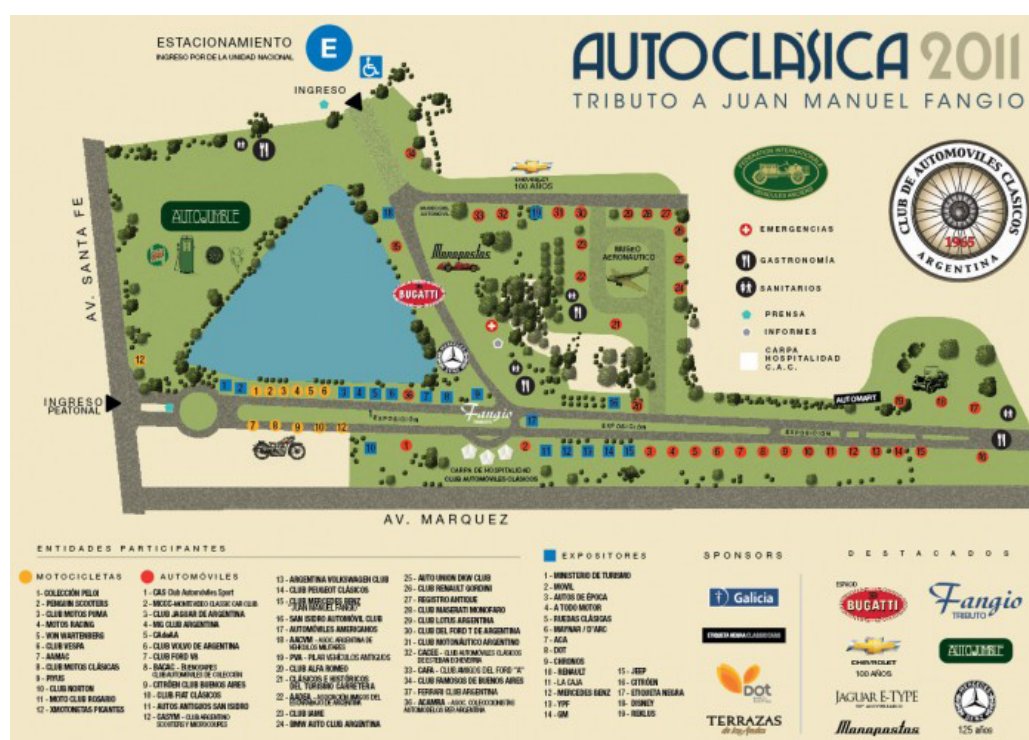
El Mapa. Un gran plano para ubicarse dentro de la gran exposición.

Agradecemos a los Organizadores y a los responsables de Prensa y Comunicación de Autoclásica por la atención brindada así como la oportunidad de cubrir y disfrutar este evento único. Muchas gracias! y esperamos volver a visitarlos el año próximo. 🚌