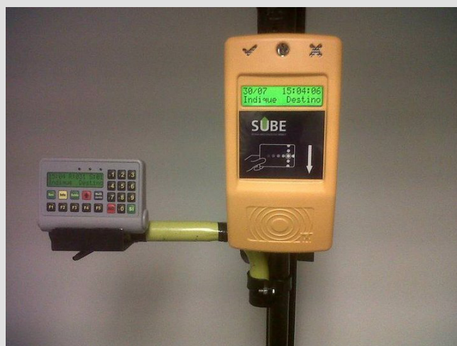
Uno de los modelos de validadores del Sistema Unico de Boleto Electrónico (SUBE) en Argentina.

El transporte público en Croacia posee hace años su sistema prepago con tarjeta magnética. La casualidad se da al encontrar un modelo de validadora similar en Argentina años después. Las únicas diferencias visibles que han cambiado son la luz que indica el correcto pago (la flecha por un tilde) y la pantalla digital táctil por un pequeño visor.