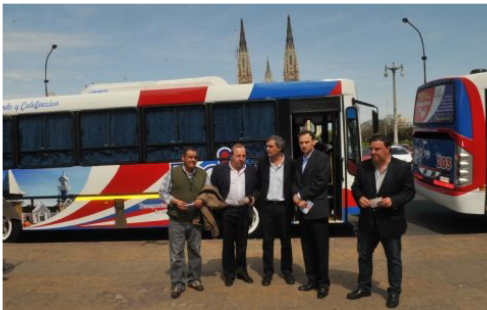
El Jefe Comunal destacó que estos micros ayudarán a aumentar la frecuencia.

Al respecto, el Jefe comunal destacó que "estos colectivos nos permiten reforzar y aumentar la frecuencia, además de ofrecer un servicio moderno y confortable que el vecino platense se merece".