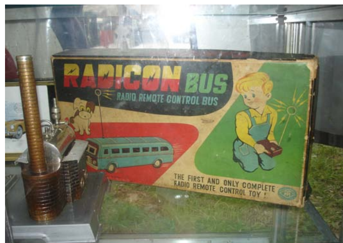
Un colectivo a radiocontrol de los años 70.