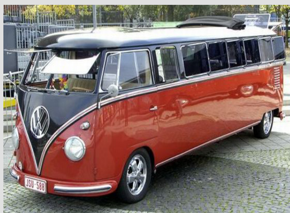
Una Limousine minibús con estilo de los años '60