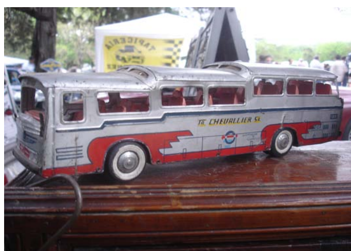
Desde Matchbox hasta los famosos colectivos de lata Bedier, de las Empresas "La Internacional" y "Chevallier". También había una unidad de la Línea 32 "El Puente"