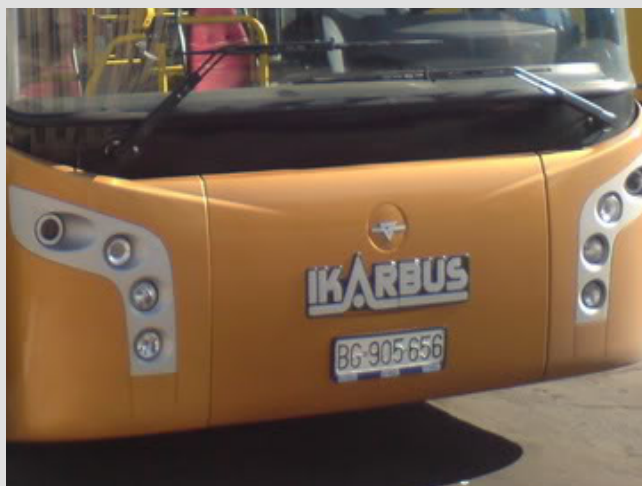
Insignia Carrocerías Ikarbus