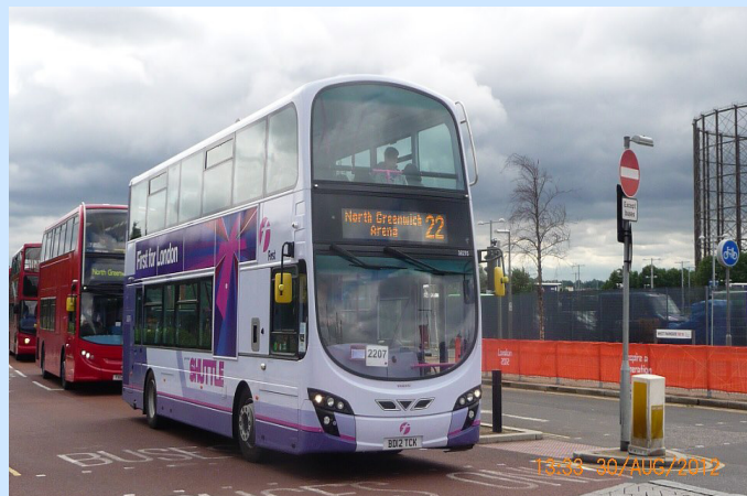
First Games Transport's 36276 (BD12 TCK)

West Parkside/Edmund Halley Way, North Greenwich -2012 http://www.facebook.com/43002Techniquet