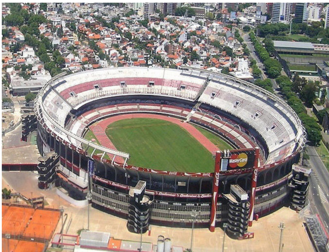
El Estadio de River Plate será una nueva parada del Bus Turístico de la Ciudad

El nuevo circuito apunta a que más barrios crezcan como lugares turísticos y que sirva como disparador de actividades. Además la propuesta no está dirigida sólo para turistas sino también como un atractivo para el público local, para que pueda disfrutar la Ciudad desde otra perspectiva. "Es una campaña de concientización del programa 'Viví la Ciudad como turista'. Es muy importante que el ciudadano que forma parte de la comunidad residente esté integrado al turista y vea que es una forma de disfrutar Buenos Aires", comentó el ministro de Cultura porteño Hernán Lombardi.