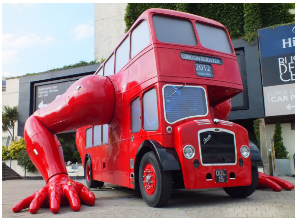
El "London Booster", una de las atracciones de los Juegos Olímpicos 2012.