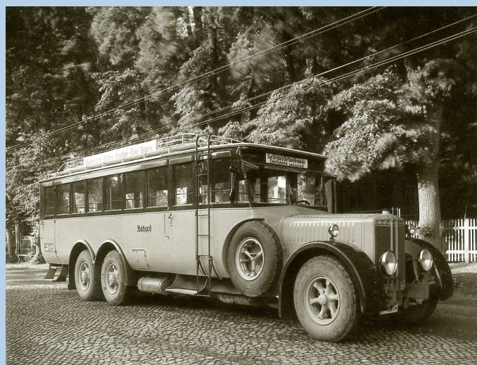
Bussing VI 1927