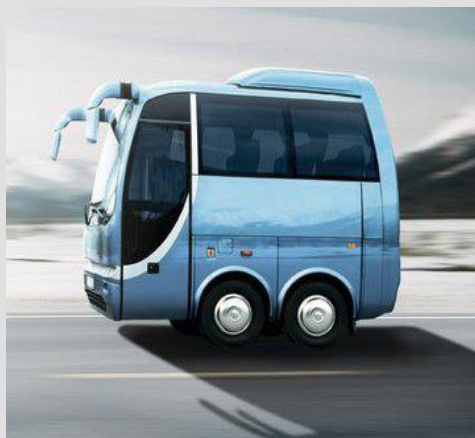
El famoso "Mini Bus"