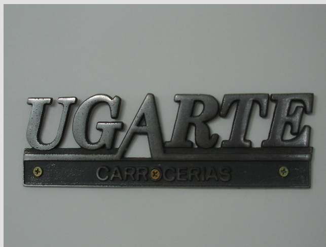
Insignia Carrocerías Ugarte (No es la actual ya que fue rediseñada)

En esta edición, les presentamos dos insignias de fabricantes de carrocerías muy similares. El recurso utilizado en la letra "A" se presenta en ambos de la misma forma.