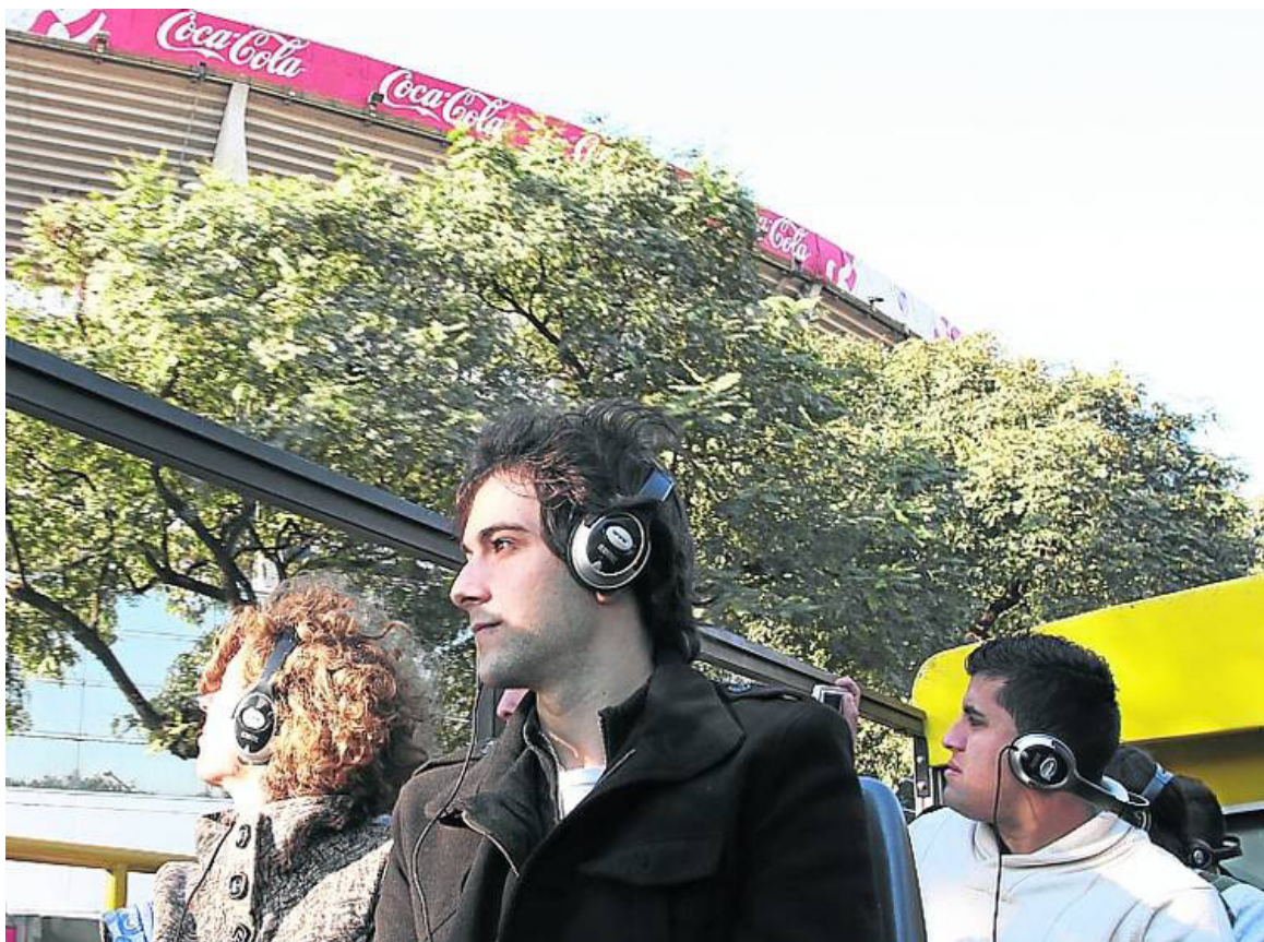
El Monumental. Ayer se realizó el viaje inaugural del flamante recorrido.

A partir de hoy todos los que saquen el abono para el bus, podrán optar entonces por la nueva ruta que empalma con la tradicional sólo en dos lugares específicos: el Planetario y el Museo Sívori , en el Rosedal de Palermo. No se paga ningún adicional, los micros salen cada una hora y se los identifica con el cartel "Ruta Azul".