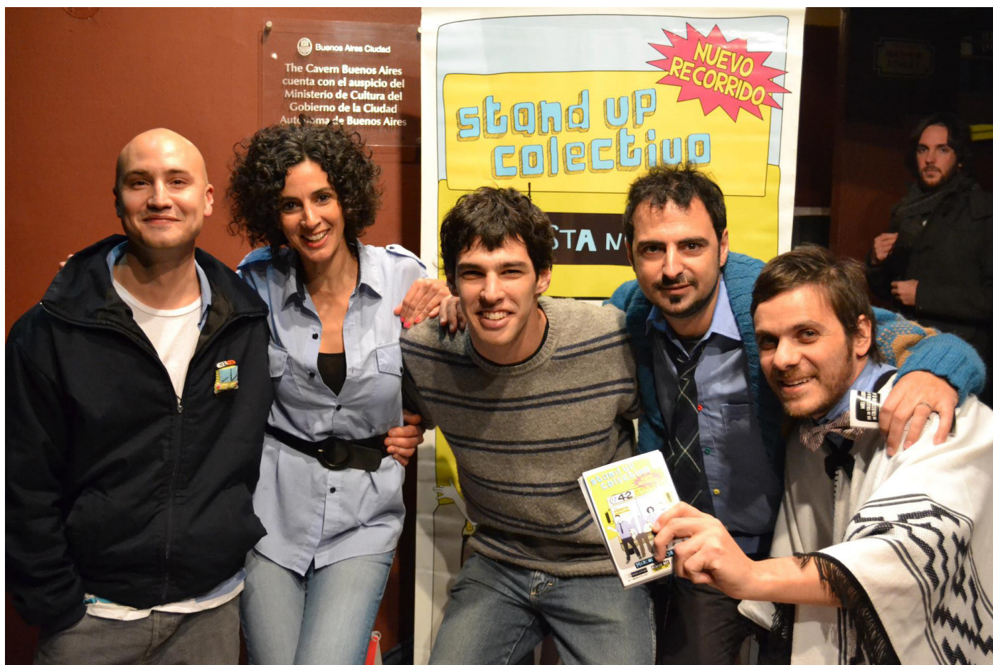
Junto con los protagonistas