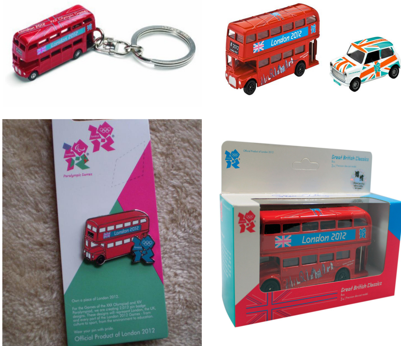
El pin, el llavero y el bus a escala con la gráfica de los Juegos Olímpicos.

Por otra parte, los Juegos Olímpicos siempre ofrecen su Merchandising Oficial. Entre ellos les presentamos algunos muy particulares.