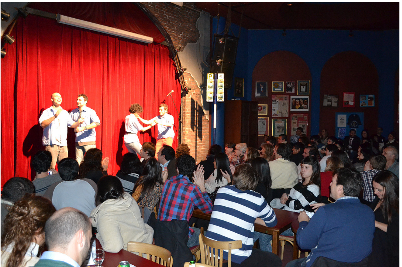
Un pasito para el fondo que hay lugar... La sala The Cavern ya quedó algo chica para el show...