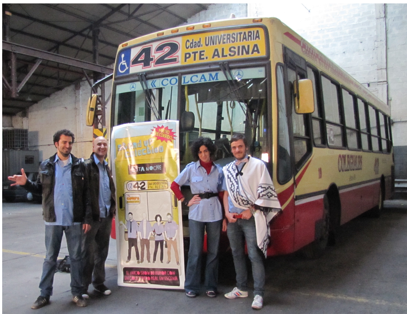
El backstage del elenco se realizó junto con unidades de la Línea 42.