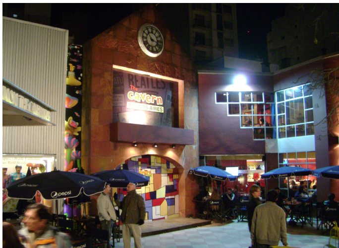
Una vista del complejo The Cavern Club en el Paseo La Plaza

Algunas imágenes de la visita al "Stand Up Colectivo" de Revista Colectibondi el 25 de Julio de 2012.