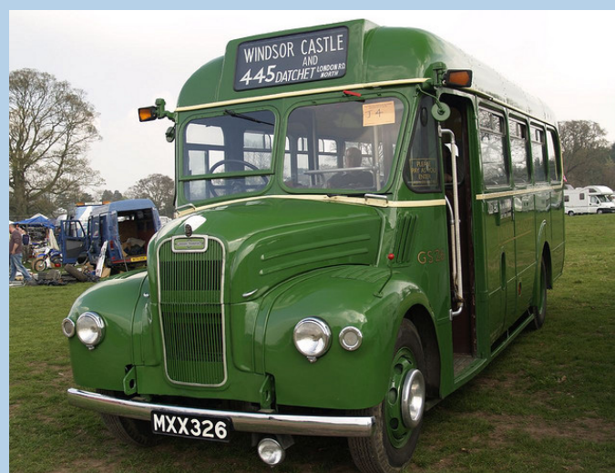
Green London Transport Bus - 1953