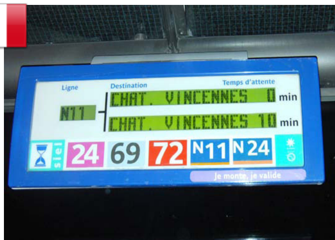
El sistema de paradas inteligentes digitales. (Edición N° 64 - Noviembre 2011)

Juan Manuel, también nos envió su artículo luego de su visita a Inglaterra en la cual rescato algunas imágenes sobre los famosos "Double Decker" rojos. Se pueden apreciar modernas unidades que conservan su viejo espíritu.