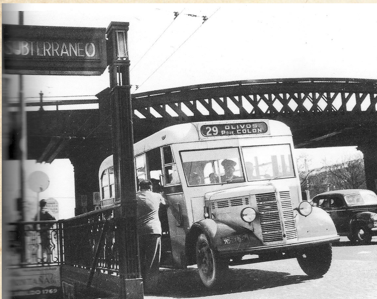
“BEDFORD OB EN PUENTE PACÍFICO” - 1951 - ARGENTINA

Un espacio para volver a ver el pasado del transporte de colectivos con fotos históricas de unidades, objetos, memorabilia y su contexto histórico.