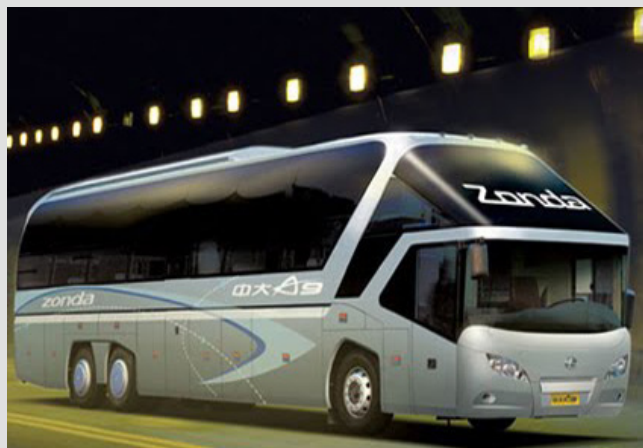
Zonda Bus & Coach Group Modelo A9

En esta edición, les presentamos dos unidades muy similares de autobuses de larga distancia.