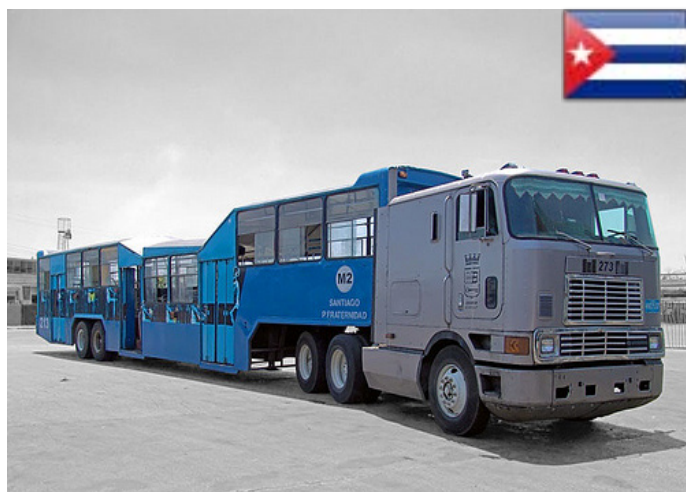
Los famosos "Camellos" o "Trailer Bus" (Edición N° 68 - Marzo 2012)