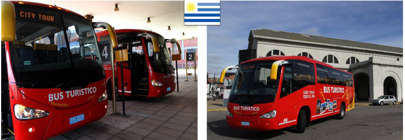
Buquebus elige los buses Irizar New Century para su renovada flota. (Edición N° 66 - Enero 2012)

Cruzamos el charco para presentarles la moderna flota de buses que Buquebus posee para su servicio de Bus Turístico en Colonia, Uruguay. En esa ciudad el recorrido posee 10 paradas. La frecuencia es de 1 hora.