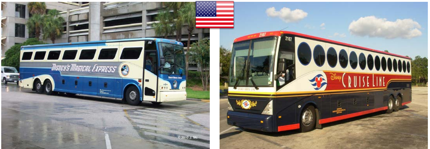
Las diferentes empresas que transportan a los visitantes de Disney desde el aeropuerto hacia los hoteles y dentro de los parques. Cuentan con una flota de aproximadamente 300 unidades. (Edición N° 67 - Febrero 2012)