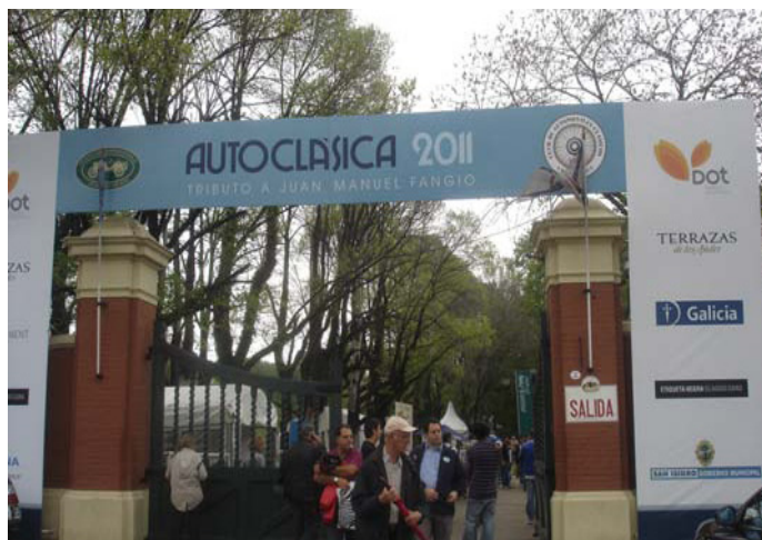
La entrada a Autoclásica realizada en el Hipódromo de San Isidro.

Estuvimos presentes en el Barrio de Parque Patricios, donde se encuentra el Museo Tomás Espora, para disfrutar de la Noche de los Museos 2011, con la participación del Museo del Colectivo.