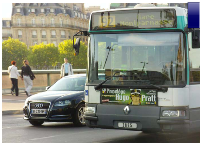
Un flamante Renault Agora circulando por París

La iniciativa de la empresa RATP, la empresa con más influencia en el transporte de París, con relación al cuidado del medioambiente, comenzó hace 2 años a utilizar autobuses híbridos de fabricación alemana que ahorran entre un 20% y 25% de combustible y reducen la contaminación sonora.