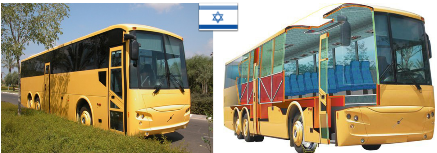
MARS DEFENDER. El modelo blindado se produce sobre chasis VOLVO B12B 6X2. (Edición Nº 62 - Septiembre 2011)

En esta ocasión, al presentar un resumen, elegimos volver a mostrarles el "Mars Defender". Se trata de una unidad totalmente blindada que permite circular por rutas susceptibles a ataques terroristas.