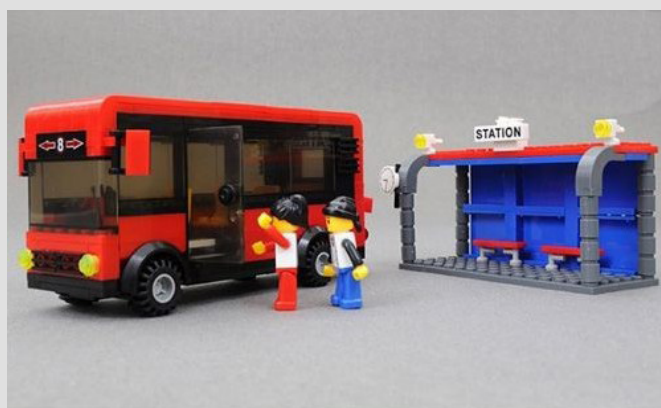
Un colectivo junto a una parada de LEGO.