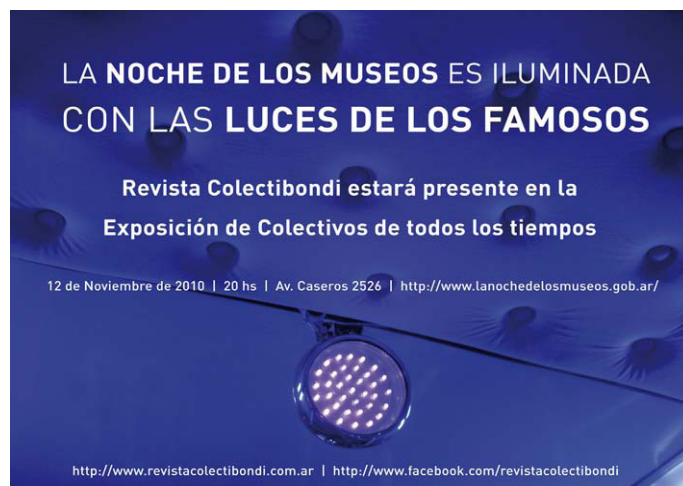
El flyer realizado por Revista Colectibondi para promocionar la Noche de los Museos 2011.