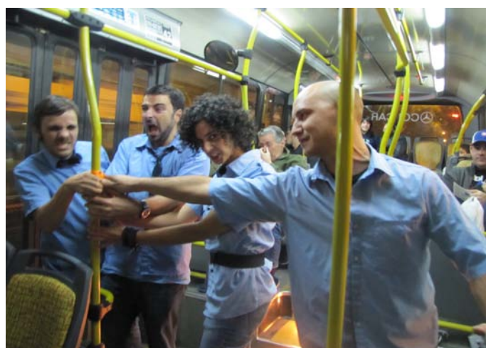
Los protagonistas de "Stand Up Colectivo"