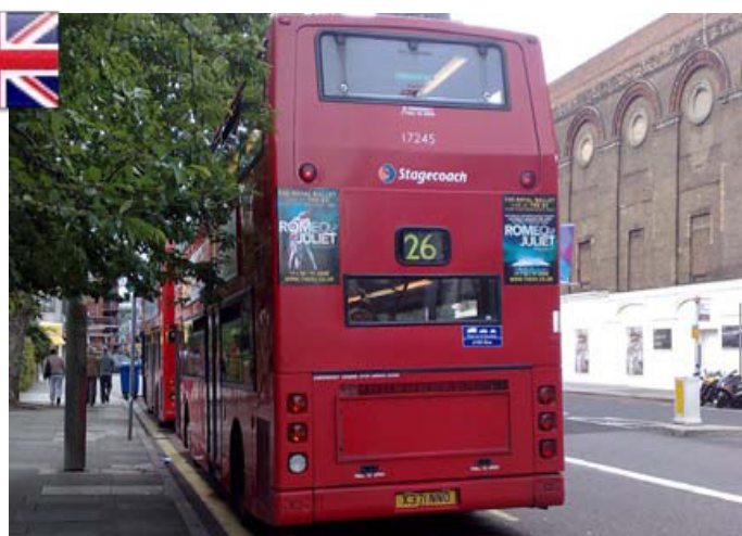
Izq. Uno de los modelos más modernos de los "Double-Decker". Der. Un modelo más antiguo de las famosas unidades. (Edición N° 65 - Diciembre 2011)