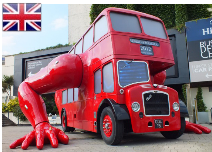
El Hotel Bus recorre destinos exóticos en los 5 continentes. (Edición N°72- Julio 2012)

Para finalizar nuestro 5° año, cerramos nuestra sección Internacional visitando Londres, Inglaterra para presentarles un bus doble piso modificado para los Juegos Olímpicos 2012 que se realizaron en esa ciudad. David Cerny re-modeló el tradicional autobús de dos pisos de Londres en una escultura mecánica de un atleta haciendo flexiones, para celebrar los Juegos Olímpicos 2012