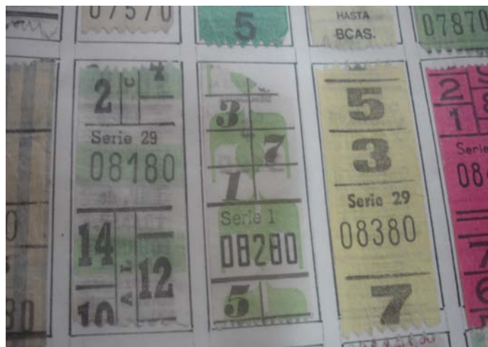
Algunos boletos presentados en el almuerzo del Círculo de Coleccionistas de Capicúas.

La Revista N° 63 (Octubre 2011) fue una edición especial dedicada integralmente al evento.