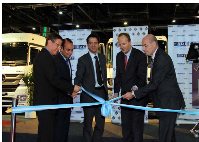
La inauguración con el famoso corte de cinta.

Por último, para cerrar nuestro 5º año, fuimos invitados a presenciar una obra de Stand Up protagonizada por un chofer de colectivos "real" en el Paseo La Plaza. La recomendamos!!!