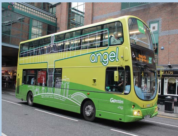
Go North East: 3965 NK06JXB Volvo B7TL/Wright

http://www.flickr.com/photos/emdjt42/8122145416