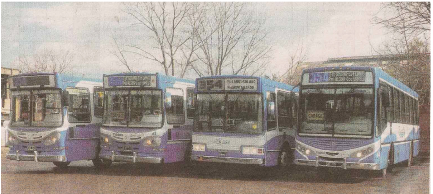
Parte del parque automotor de la línea 354 al servicio de los usuarios

La buena rentabilidad de estos sistemas dio paso a otros pedidos de concesiones y en sólo cinco años la actividad se había convertido en un negocio de tal magnitud que ya presentaba una seria competencia para el sistema tranviario.