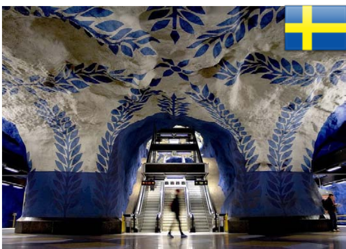
Los famosos "Camellos" o "Trailer Bus" pueden transportar más de 200 pasajeros. (Edición N° 70 - Mayo 2012)

En una de las visitas a Suecia, descubrimos una galería de arte subterránea en el metro de Estocolmo. En sus cien estaciones, el metro de Estocolmo ofrece una verdadera exposición artística.