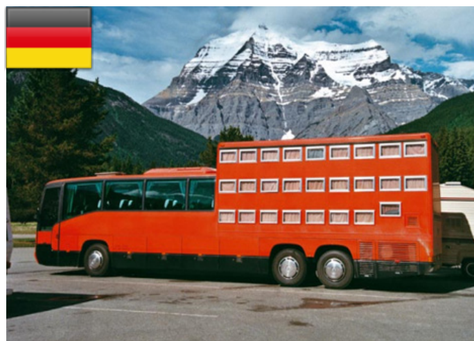
El Hotel Bus recorre destinos exóticos en los 5 continentes. (Edición N° 69 - Abril 2012)

En una de las visitas a Suecia, descubrimos una galería de arte subterránea en el metro de Estocolmo. En sus cien estaciones, el metro de Estocolmo ofrece una verdadera exposición artística.