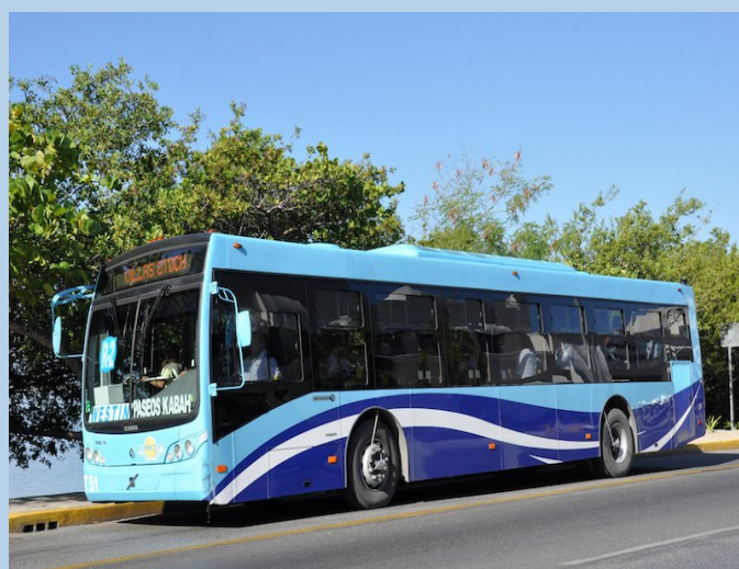
Mexico - Cancún