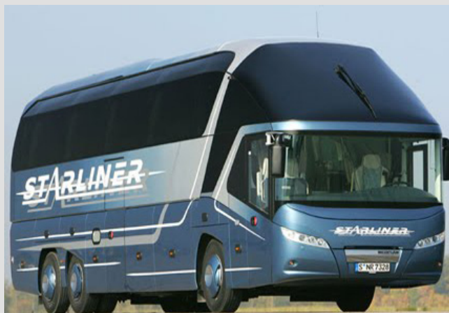
Neoplan (M.A.N. A.G.) Modelo Starliner