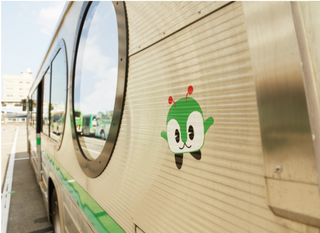
La mascota está presente en todas las unidades. Su nombre es "Minkuru".