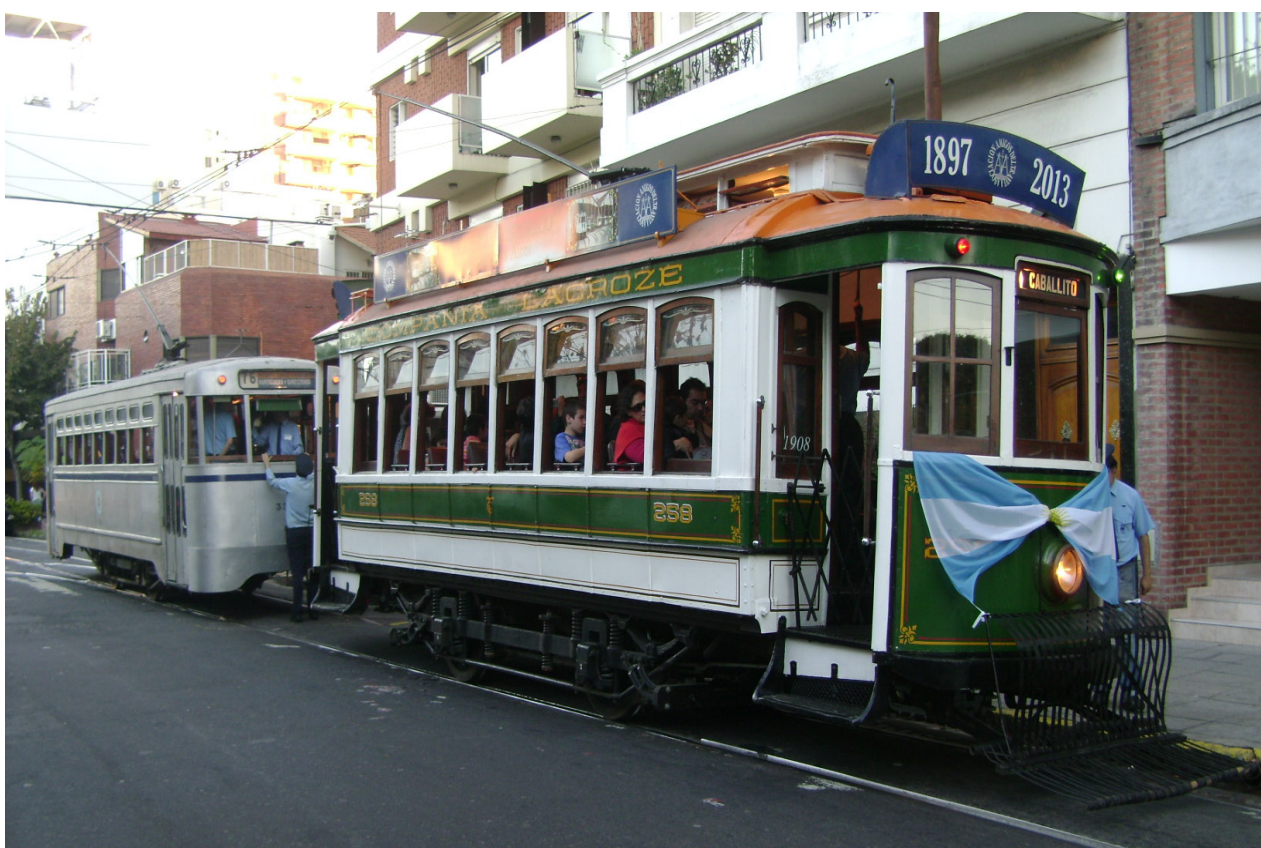
En primer plano se ve al "Lacroze N°258", detrás el 3361 FM

Con motivo de conmemorarse el 116° aniversario de la puesta en marcha del primer tranvía eléctrico de Buenos Aires, con un trayecto experimental en Av. Las Heras entre Canning y Plaza Italia, la Asociación de Amigos del Tranvía (AAT) volverá a incorporar a sus tradicionales paseos por el circuito de Caballito el tranvía N° 258, fabricado en Oporto (Portugal) en 1927 y restaurado como réplica de los coches de la compañía Lacroze.