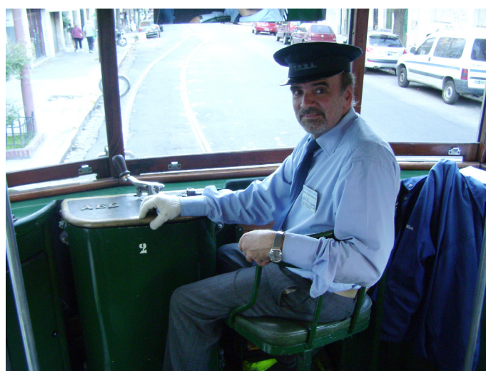
El conductor del "3361 FM" en la cabina de mando.

La convocatoria tuvo lugar el Domingo 21/4 entre las 16 hs. y las 19:30 en la esquina de las calles Emilio Mitre y José Bonifacio, en el barrio porteño de Caballito. El paseo es totalmente gratuito. Puede accederse al lugar desde la línea E (estación Emilio Mitre) y la línea A (estación Primera Junta).