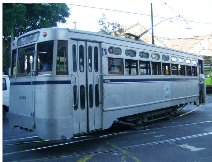
La salida de los tranvías.