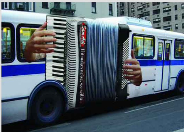
Publicidad de Acordeón