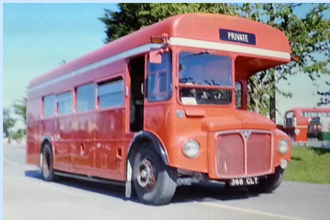
Double Decker / One Decker

https://www.facebook.com/groups/237902229655680/