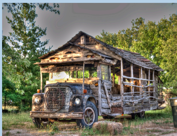
Autobús de madera - Ozark Mountains - Estados Unidos

http://www.flickr.com/photos/26181971@N07/8742386268/