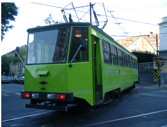
Detrás de los tranvías se pudo apreciar funcionando un vehículo de 1913 reacondicionado para prueba del Premetro.