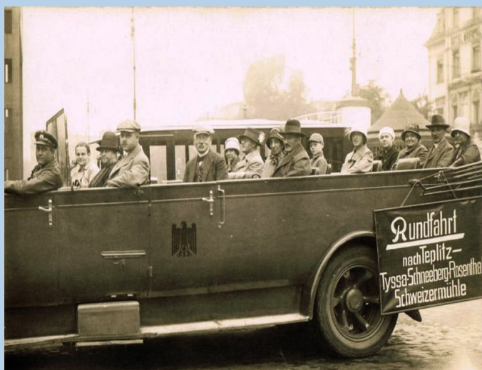
República Checa - Alemania - Tour - Dresde a Teplice

http://www.flickr.com/photos/26181971@N07/8742386268/