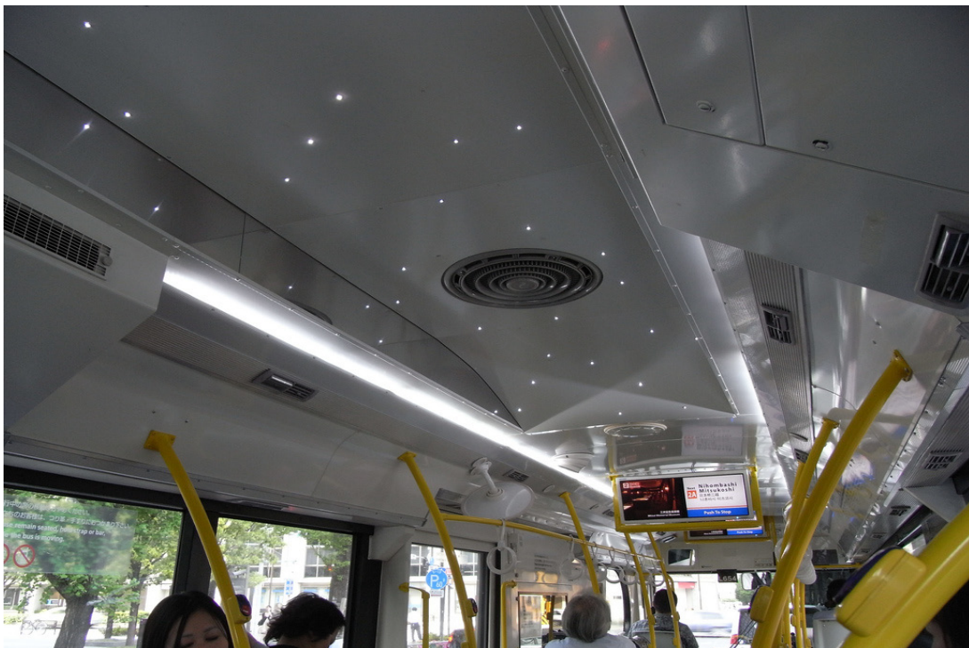
El techo del autobús se encuentra decorado con luces que simulan un cielo con estrellas.