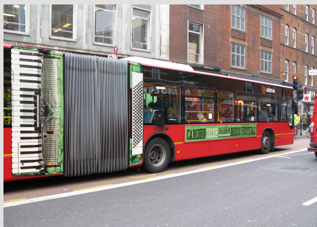
Publicidad de Festival de Música

En esta edición, les presentamos un recurso muy utilizado en las unidades articuladas.