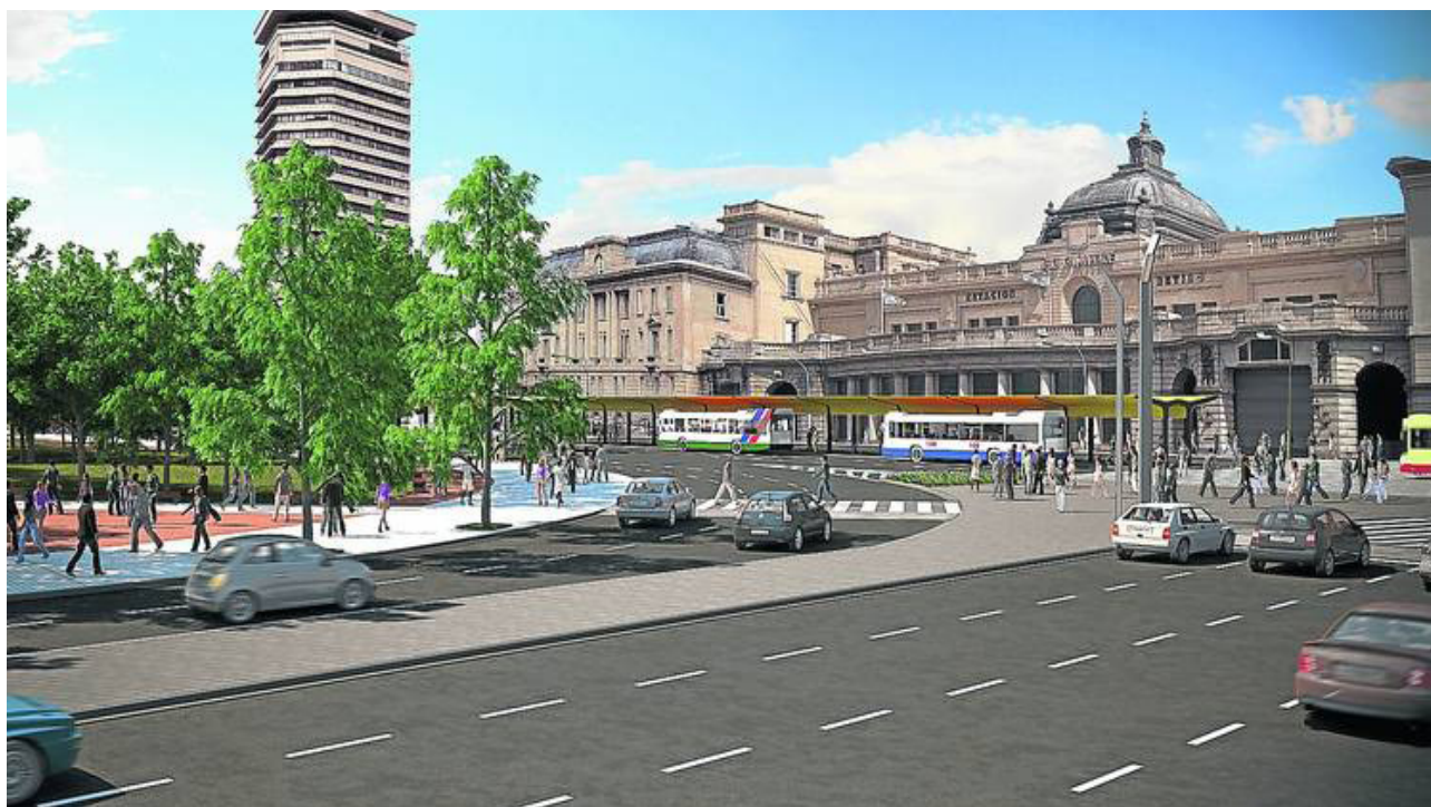
Render que muestra cómo quedarán las veredas y dársenas frente a la estación Mitre.

Las mejoras también impactarán en las tres líneas de ferrocarriles (Mitre, Belgrano Norte y San Martín), en la Terminal de Ómnibus, en las 30 líneas de colectivos que circulan por allí y en la línea C del subte.