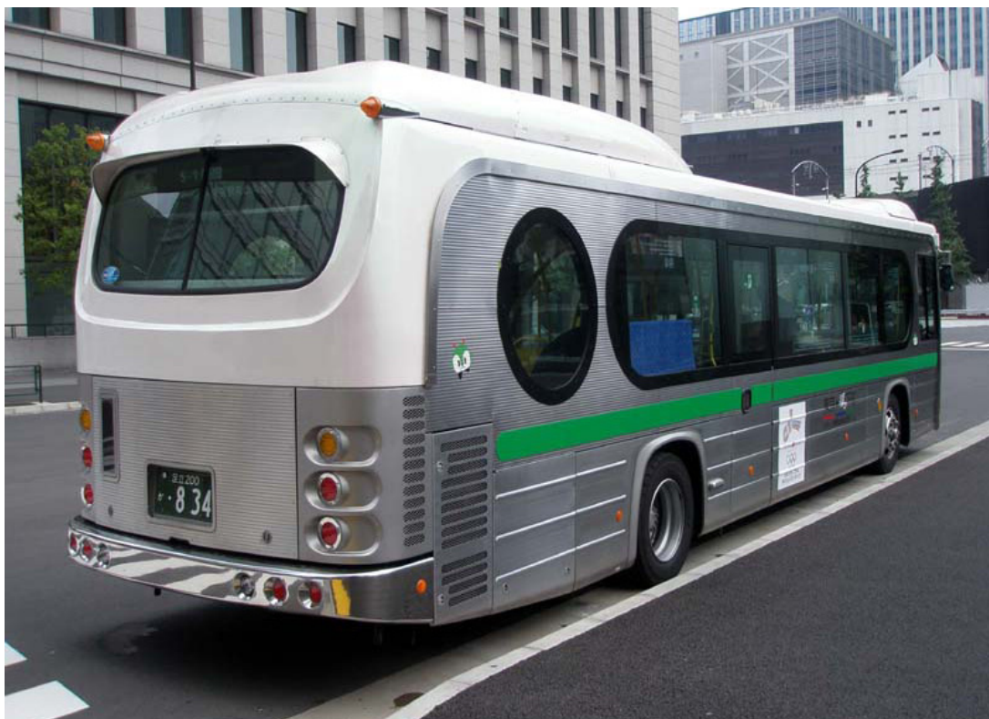
Las ventanas redondeadas llaman la atención de transeúntes de la ciudad.