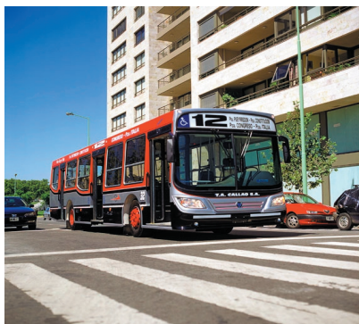
Los Modelos Italbus se adaptan perfectamente a distintas modalidades.

"Nuestra intención es desarrollar y presentar un producto fabricado para aumentar el rendimiento empresario y generarle un un beneficio al público usuario, brindándole un vehículo de alta calidad, probada calidad y notable comodidad para el pasajero".