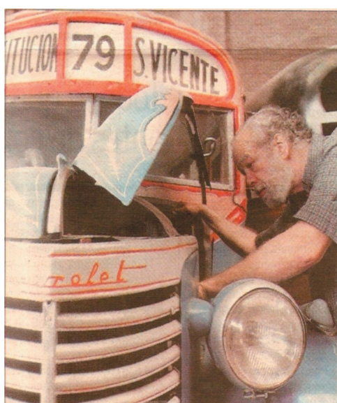
Colectivos tradicionales ya fuera de circulación.

La coordinación de la payada estará a cargo de Rodolfo Visco, conocido popularmente por su participación como "el tachero memorioso" en el programa radial de los sábados de Victor Hugo Morales, así que todo estará a tono con la circunstancia.