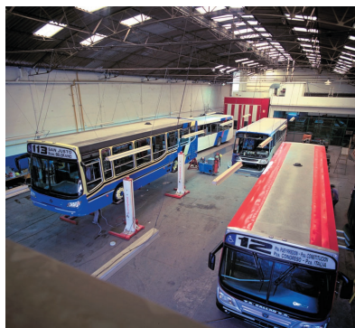
La empresa dispone de una planta de producción en Avellaneda