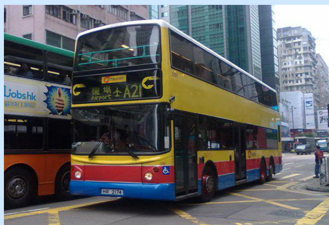
CitiBus CTB (Chna)

http://www.facebook.com/groups/69139028785/