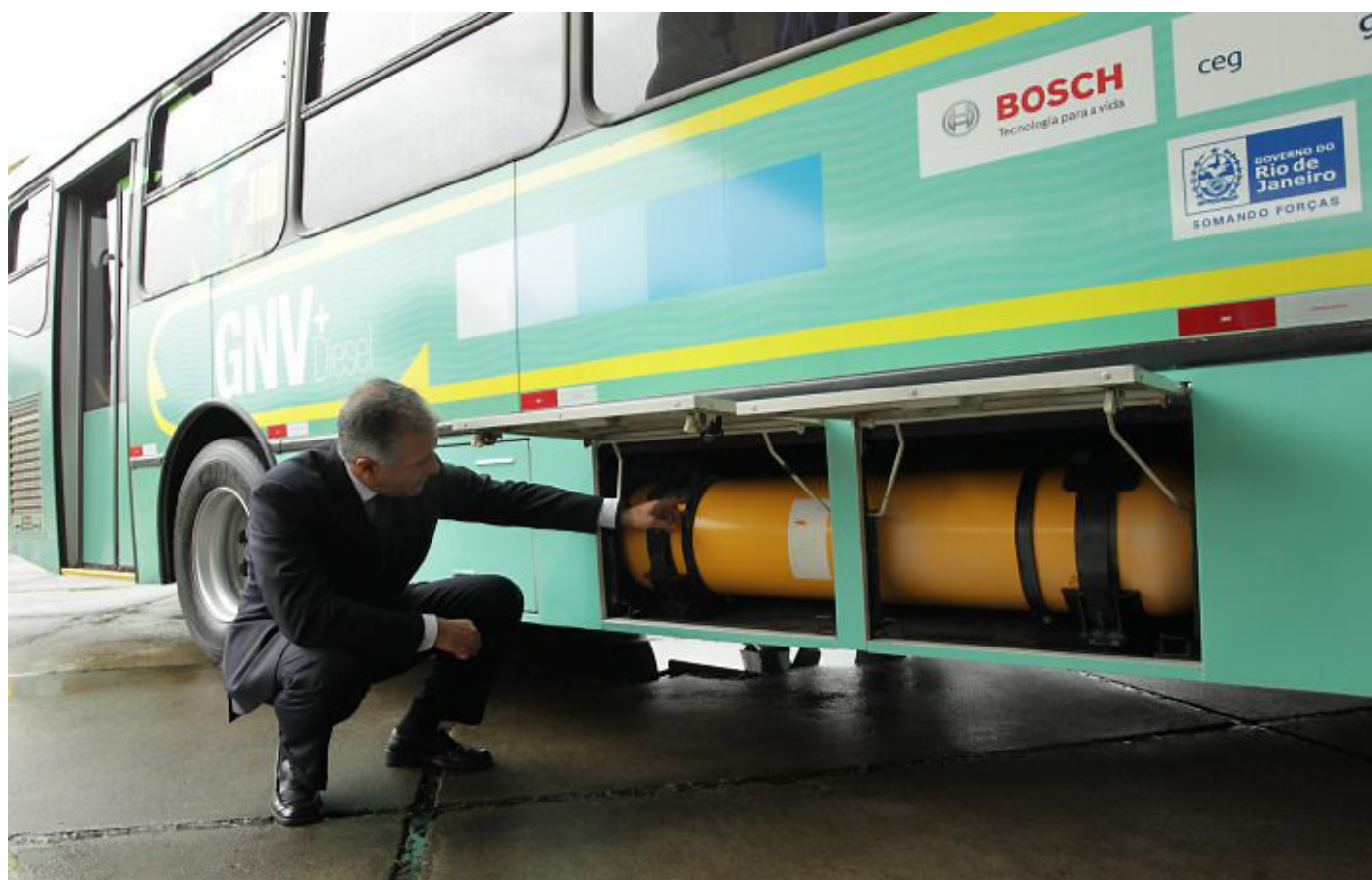
El lugar donde se ubica el tanque de gas

“El prototipo de Volkswagen presenta una alternativa real al diesel, reduciendo el uso de combustible y la emisión de contaminantes en la atmósfera. Por otra parte, al ser capaz de usar GNC y diesel, el autobús no es restringido por un solo combustible, permitiéndole a los dueños de las flotas operar el vehículo en áreas sin abastecimiento de gas,” dijo Roberto Cortes, presidente de MAN Latinoamérica.