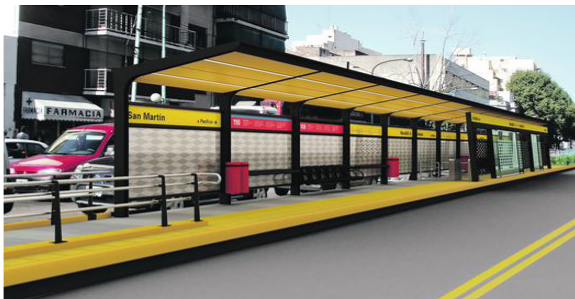
El Metrobus Actual posee 21 estaciones ubicadas a 400 metros cada una.

Según datos oficiales, los 44 minutos diarios que ahorran los pasajeros del Metrobús de Juan B. Justo representan unos siete días por año.