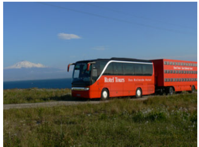
40 plazas de autobús con remolque, versión clásica.

En la parte trasera del remolque se localiza una cocina, en la cual se preparan los alimentos, para los pasajeros y para la tripulación (1 chofer y 1 guía).