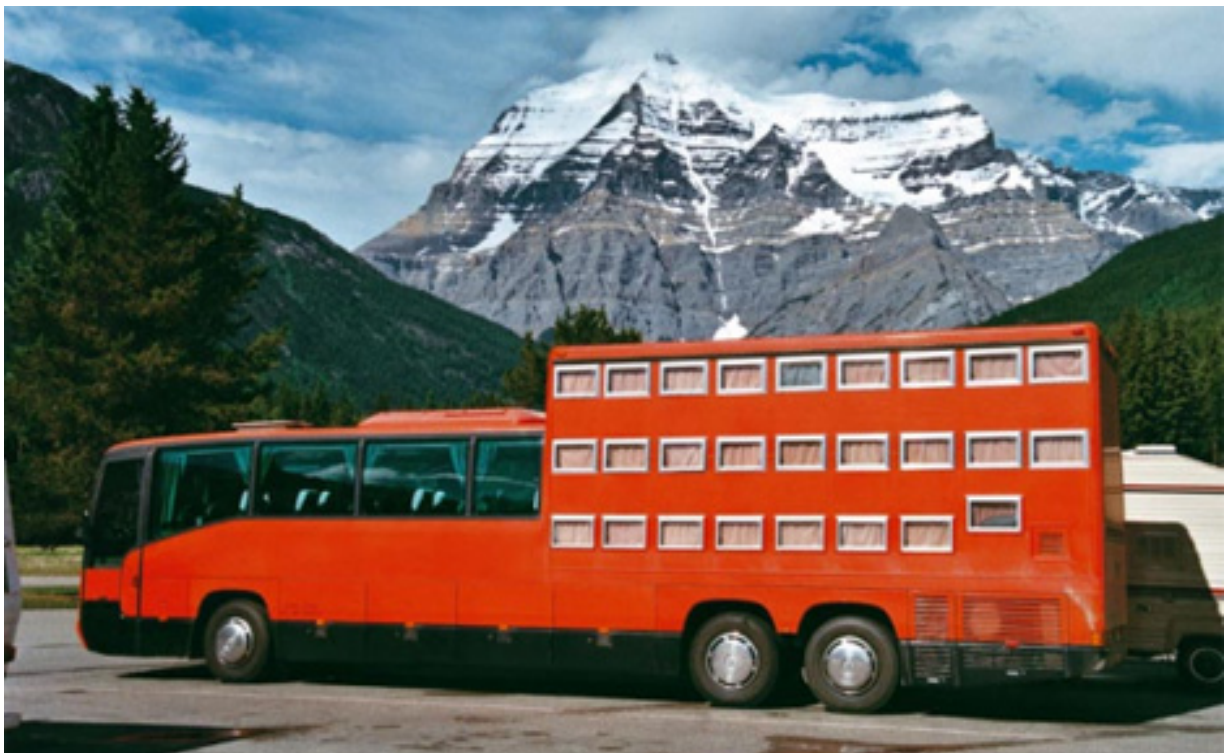
El Hotel Bus recorre destinos exóticos en los 5 continentes

Esta compañía alemana ofrece un hotel sobre ruedas con conductores calificados y guías turísticos a bordo para que los viajeros se sientan a gusto y conozcan los destinos visitados.