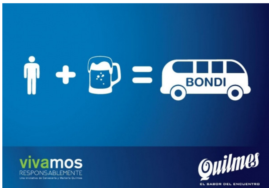
El "Bondi" presente en las gráficas promocionales de la campaña.

Desde una campaña de radio para concientizar a los comerciantes sobre la venta responsable de bebidas con alcohol sólo a mayores de 18 años hasta la nueva campaña "Comercios con códigos", Vivamos Responsablemente utilizará distintos soportes para llegar a la mayor cantidad de almacenes, supermercados, kioscos y despensas que sea posible con su mensaje: "+18 = Venta Responsable".