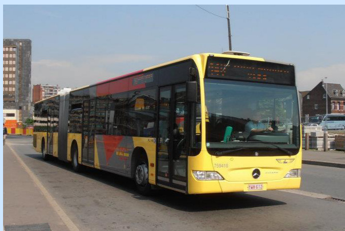
Mercedes-Benz Citaro II G - 759418 (Francia)

http://www.facebook.com/groups/69139028785/