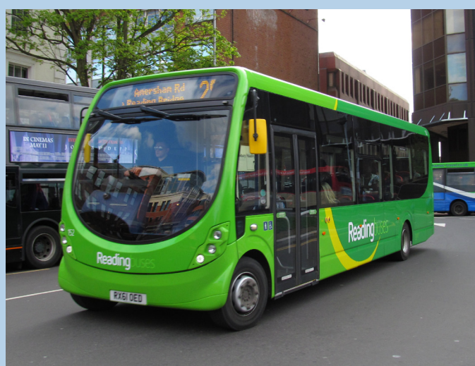
Reading Buses, 152 (RX61OED) (Inglaterra)