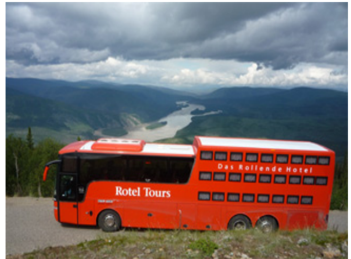
24 plazas de autobús se combinaron para el extranjero.