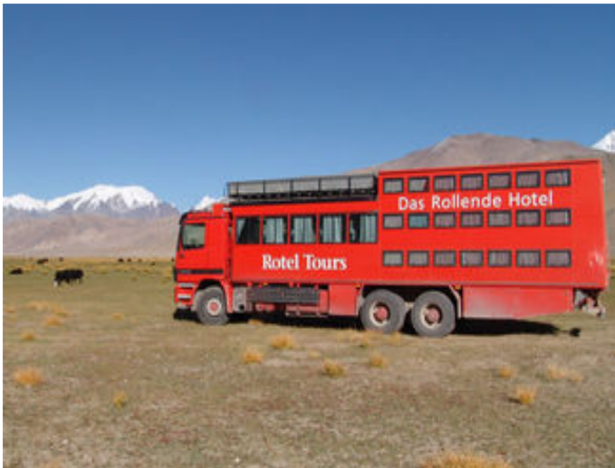
20 plazas para los viajes combinados lejos de los caminos comunes.

El "Rotel" es un invento de George Hötl. La empresa Tours Rotel fue fundada en 1945 y es pionera en el turismo. Según datos de la empresa, el tamaño promedio del grupo de viajeros es de alrededor de 24 participantes. Sumando toda su flota poseen 400 camas sobre ruedas. Brinda 4 tipos diferentes de vehículos.