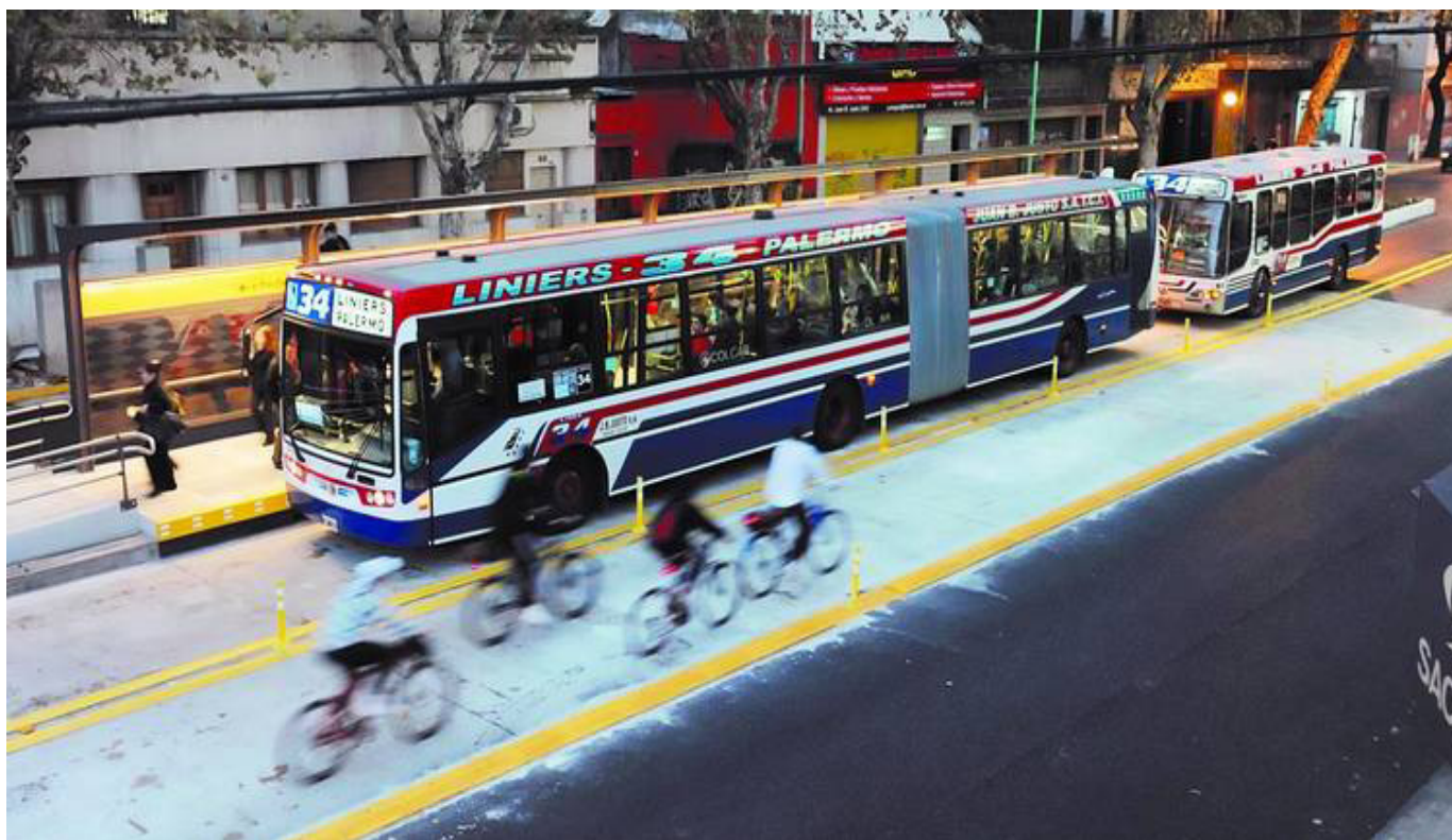
Articulados. Cuando empezó había diez coches de este tipo; ahora ya cuentan con veinte en funcionamiento.

Hoy lo usan 75.000 pasajeros por día, un 25% más que antes, y de diez coches articulados ya pasamos a contar con 20. Por otro lado, el impacto no se sintió tanto en los autos que transitan todos los días la avenida Juan B. Justo", detalló el subsecretario Guillermo Dietrich, y agregó: "El Metrobús ordena los flujos de tránsito y eso impacta muy favorablemente. Y lo beneficioso es que seguirá haciéndolo en el futuro; con el tiempo, la cantidad de autos que circulan en la Ciudad irá aumentando, y la ventaja del Metrobús será clave porque permitirá fijar el tiempo que demandará trasladarse en colectivo por la Ciudad".