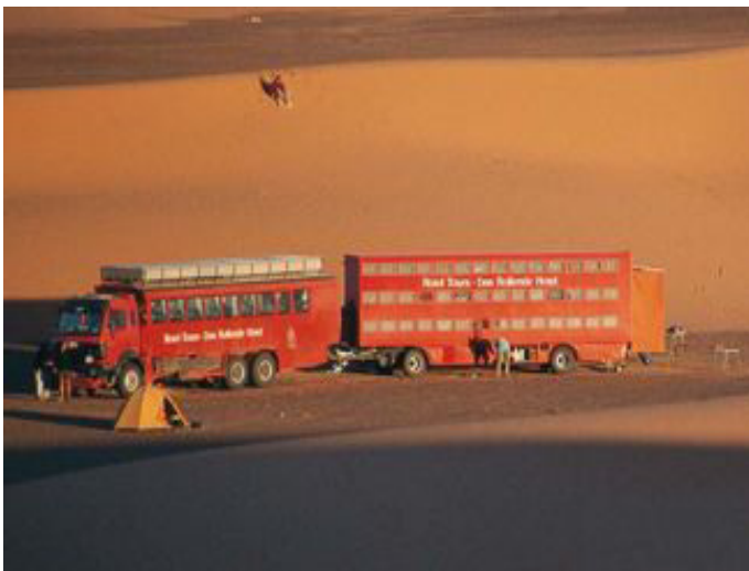
34 plazas con remolque, ideal para expediciones.