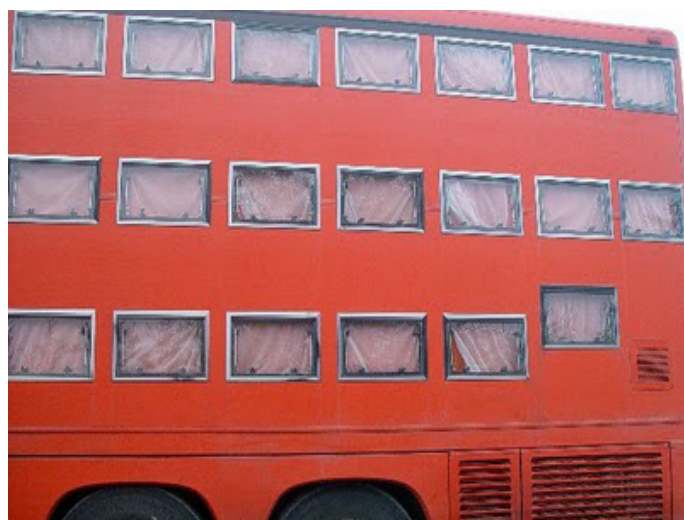
El Hotel bus ofrece habitaciones simples y dobles

Existen, variedad de vehículos que pueden transportar entre 20 y 40 pasajeros. Todos ofrecen una experiencia diferente.