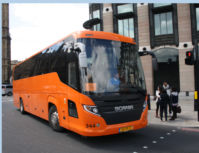
Scania Touring - BZ-VF-11 (Inglaterra)

http://www.flickr.com/photos/madphysicist/3741798493/