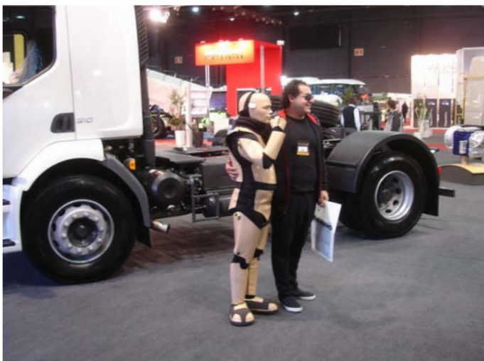
El personaje de la expo: un Crush Dummies. Fue una de las atracciones del stand.

VOLVO presentó su gama FH, el FM y el FMX.