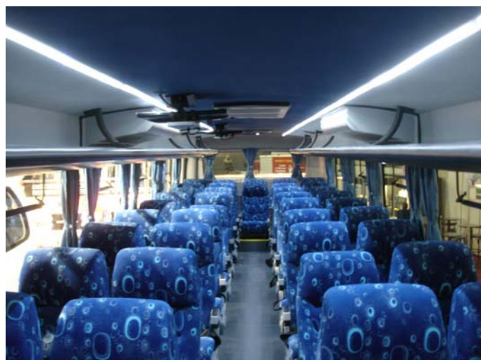
El interior del 3,6 posee iluminación LED y pantallas LCD.

Agradecemos al Diseñador de Carrocerías Lucero que estuvo presente en el stand por la información brindada acerca de los modelos y su proceso de diseño. Muchas gracias!!! 🚌