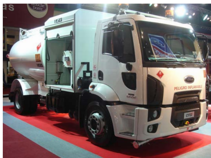
El modelo Ford Cargo 1722 adaptado para transportar combustible aeronautico. Posee una capacidad de 10.000 Litros.