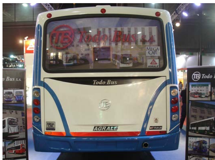
El nuevo diseño de la parte posterior de TodoBus.