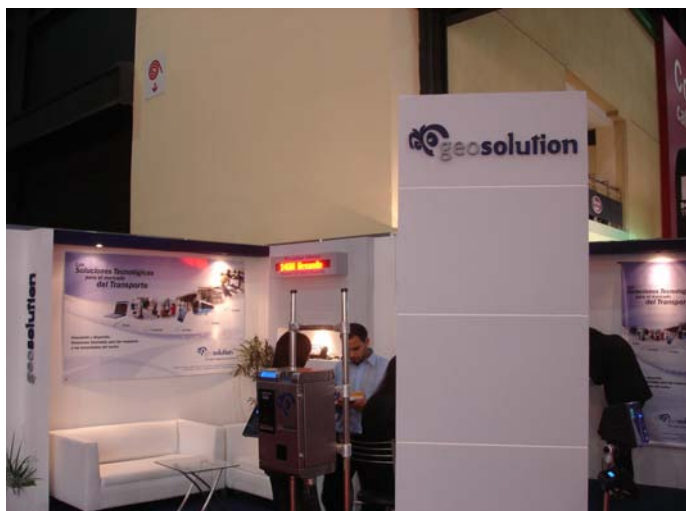
Una vista del Stand con todos sus productos en funcionamiento.

Uno de los rubros que más ha crecido en los últimos años es el Geoposicionamiento y control de flota utilizando diversas soluciones informáticas. Geosolution presentó su gama de productos y servicios.