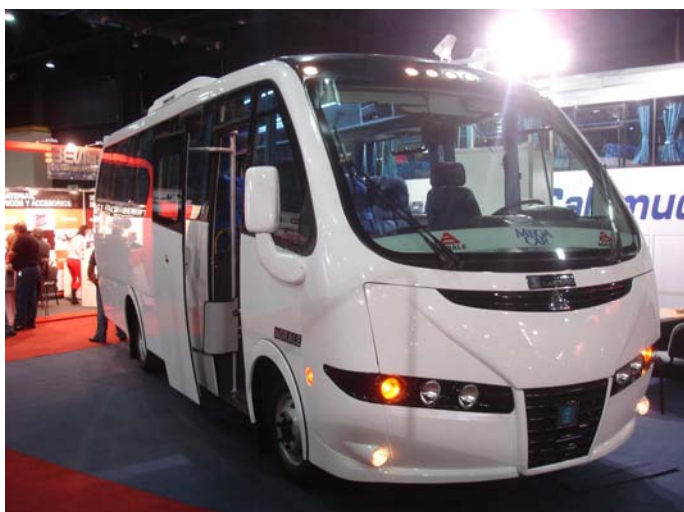
El minibus de Lucero posee un diseño con líneas modernas