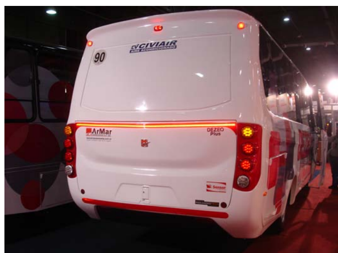
El Dezeo posee una "luneta ciega" e iluminación LED