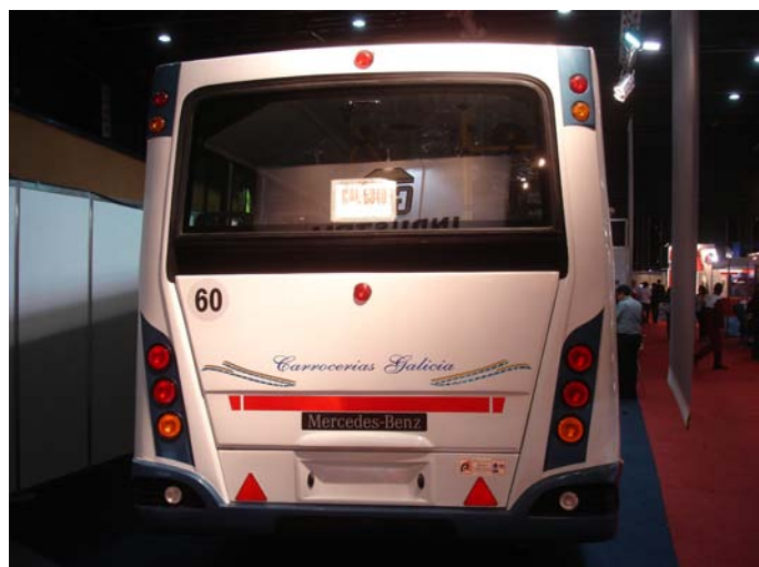
La parte posterior del modelo posee el sello que caracteriza a los modelos de la marca.

Agradecemos al personal a cargo del stand por la folletería entregada. Muchas gracias!!! 🚌