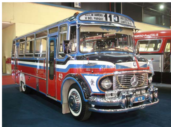
Mercedes Benz 1114 - Carrocería El Cóndor - 1982