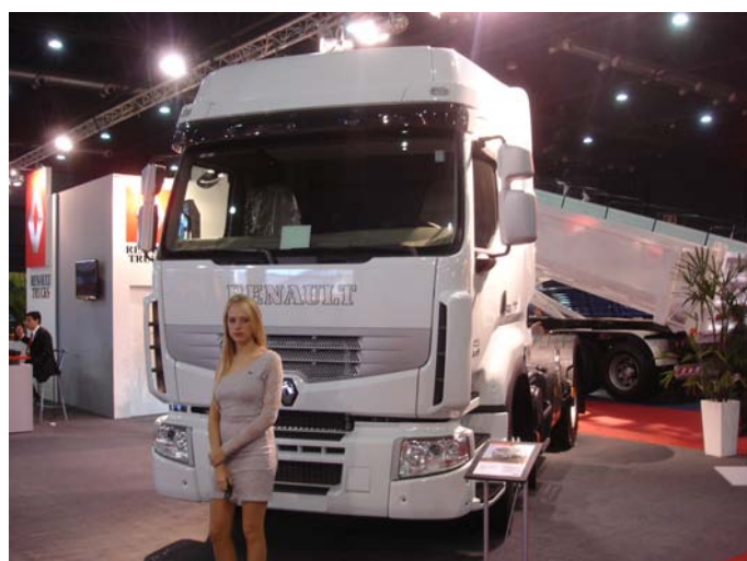
El modelo Premium 460 Euro 5

Agradecemos la atención en ambos stands y la folletería entregada con especificaciones de los productos. 🚚