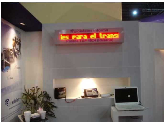
GeoArribos. Informa al pasajero el tiempo que tardará en llegar el próximo colectivo a la parada.