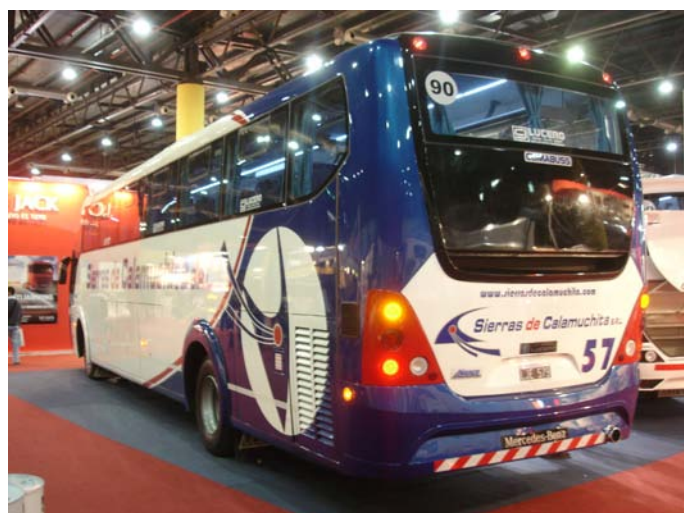
El "buque insignia" de Lucero. El modelo 3,6 carrozado sobre chasis Mercedes Benz O-500