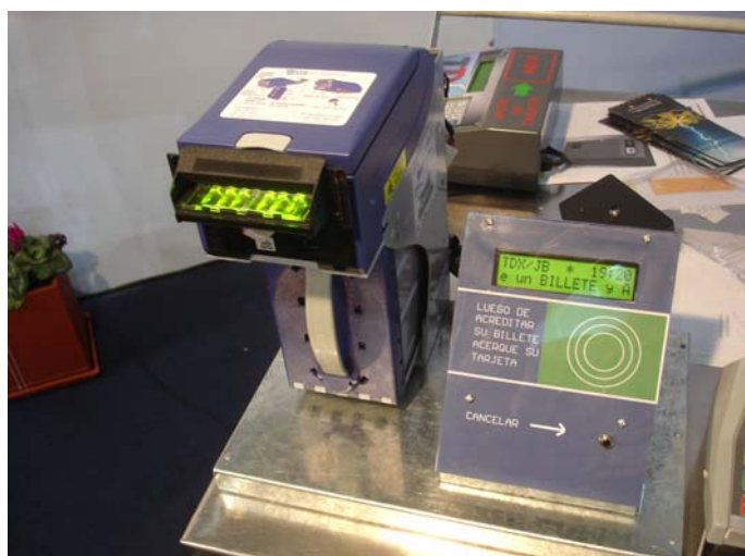
Una de sus novedades es la Expensora con lectora de billetes.