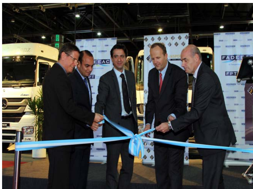
La inauguración con el famoso corte de cinta.

Durante la exposición se llevaron a cabo conferencias y talleres en base a tres ejes: "Innovaciones y tendencias en el transporte de carga", "Seguridad vial y manejo reflexivo", y "Herramientas para optimizar negocios".