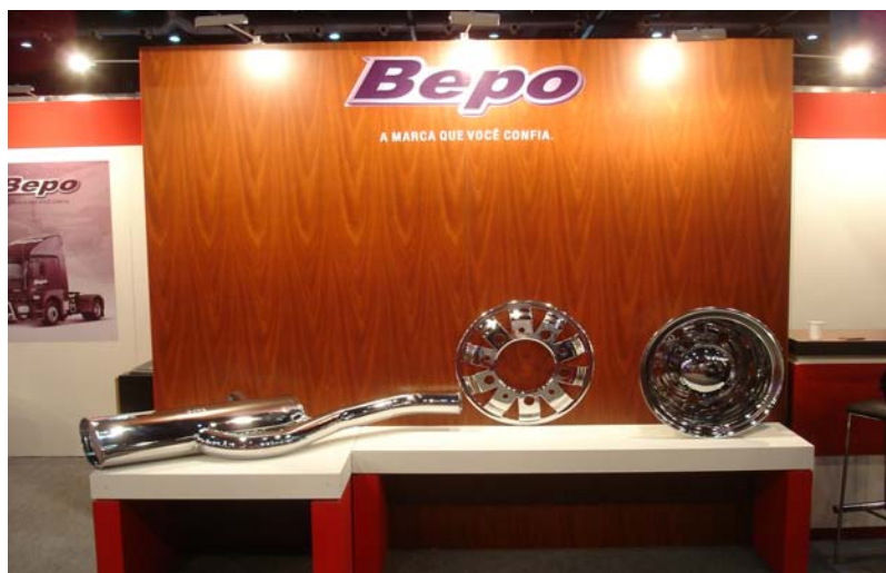
Sus modemos de tazas cromadas son las utilizadas por los colectivos "Famosos" de Buenos Aires.

En su aniversario N° 50 (1962-2012), la empresa Brasileira presentó toda su línea de productos en un stand muy moderno y bien iluminado.