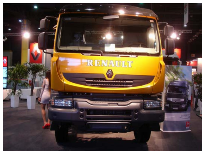
El modelo Kerax 460

RENAULT TRUCK presentó su gama Premium Lander y Kerax con motorización Euro 5 y el Renault 440 Special Edition. También montó 2 simuladores de camiones de carrera.