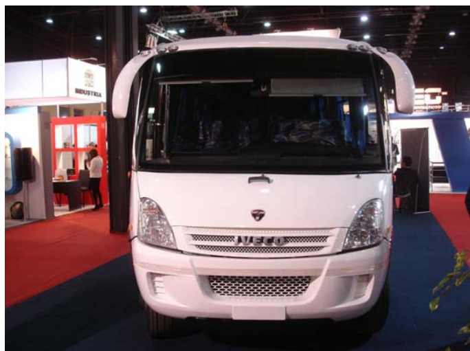
Su frente posee opticas grandes y espejos aerodinámicos.