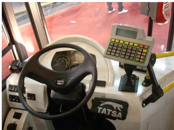
El interior del Puma D9.8 ya tenía colocados los teclados y el SUBE.