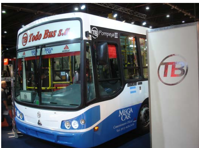
GIA presentó sus productos arriba de un Todobus.

En ambos stands nos entregaron buena folletería de los productos. 🚌