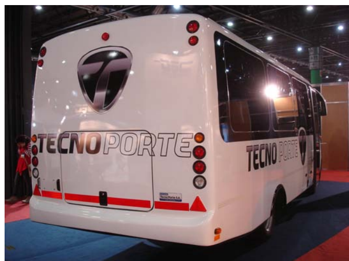
Su baul posee gran capacidad de carga para ser un minibus.