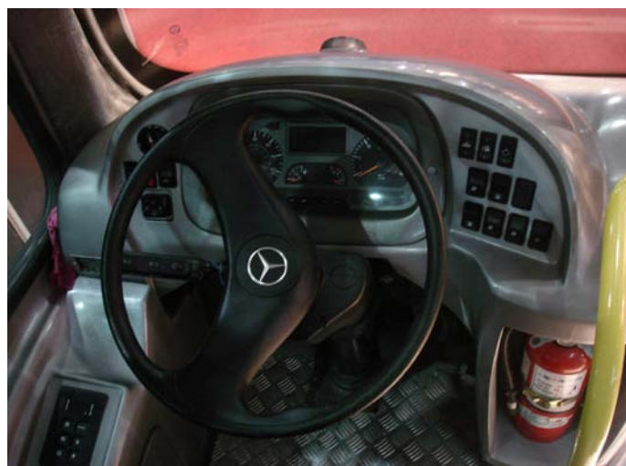
El diseño interior es simple. La ubicación del matafuego se encuentra a mano del chofer.