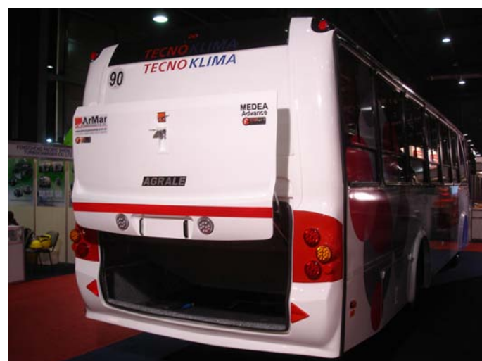
El modelo Medea de motor delantero posee un baúl de grandes dimensiones en su parte posterior.

Agradecemos al personal encargado del stand por entregarnos folletería de ambos modelos. La misma es muy completa. Incluye especificaciones de cada modelo. Muchas gracias!!! 🚌