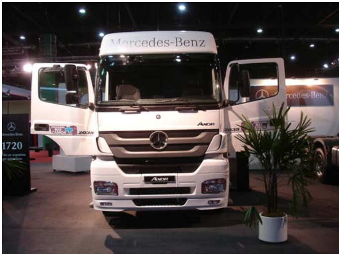
El modelo Axor 2035 CD

MERCEDES BENZ presentó su gama de modelos Actros 2636, Axor 2035 CD y el Atron 1720. Igualmente apuntó a su renovada Sprinter Minibus 19+1 (ver página 14).