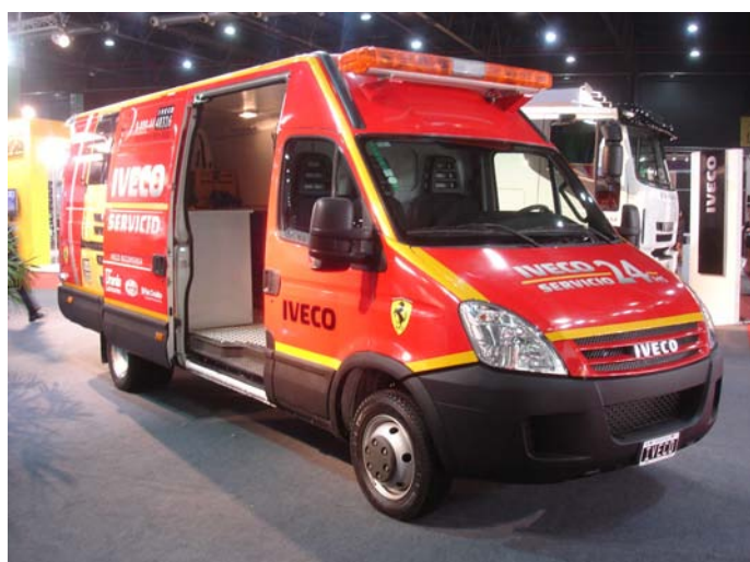
El furgón Iveco Daily de asistencia.

IVECO presentó el Iveco Cursor, Stralis y Daily. Además, la compañía aprovechó la oportunidad para organizar la 4ta charla técnica del año, y presentar el Iveco Control, un novedoso sistema de control de flotas.