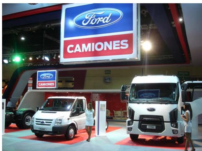
Uno de los stands mejores presentados de la exposición

En su gran stand, presentó 5 modelos de su gama Cargo 2012 Kinetic Design e introdujo la versión chasis-cabina de su Ford Transit.