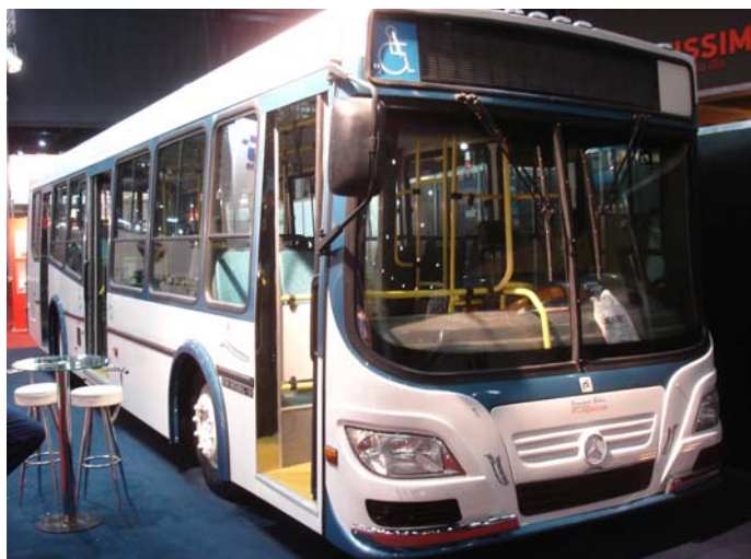
Es la primer unidad de piso super bajo que produce Galicia.

Carrocerías Galicia presentó su modelo de colectivo urbano sobre chasis Mercedes Benz OH 1621 L SB. Su capacidad puede variar entre 25y 29 asientos según requerimientos del cliente.