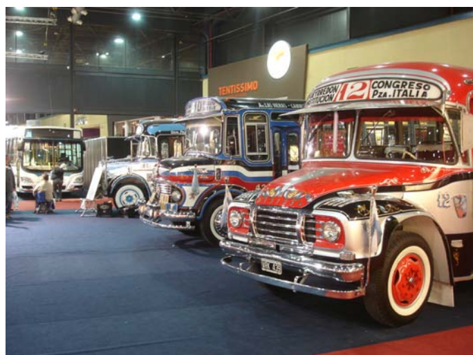
Las 3 joyas históricas y en el fondo el moderno Galicia OH 1618 L SB

También estuvo presente un fileteador realizando un trabajo en vivo junto a las unidades. Fue un lindo espacio para que los visitantes puedan disfrutar y recordar viejos tiempos del transporte en Argentina. 🚌