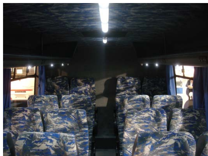
El interior del Tecnoporte cuenta con iluminación LED

Agradecemos a los encargados del stand por su atención y la folletería brindada. Muchas gracias 🚌