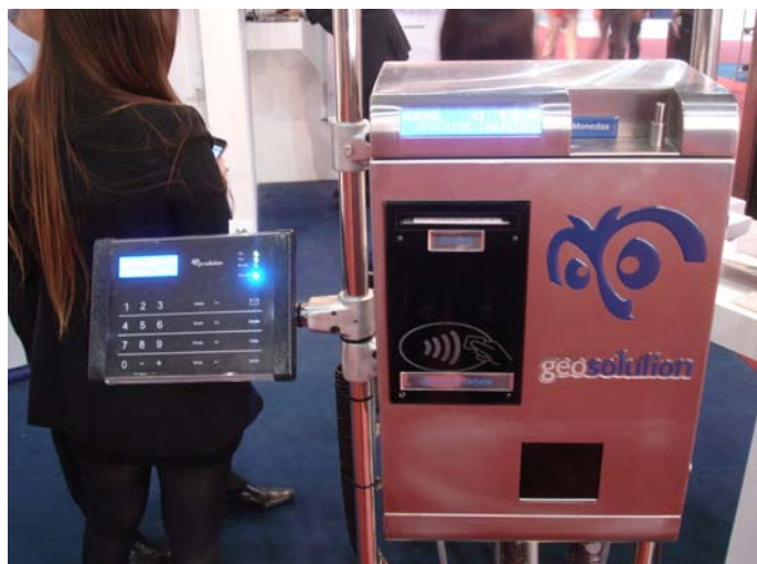
Dentro del Área de GeoTicketing se pueden encontrar varios modelos. "Full Ticketing" es uno de los más comunes.