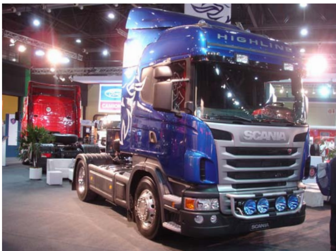
RH 470 Highline