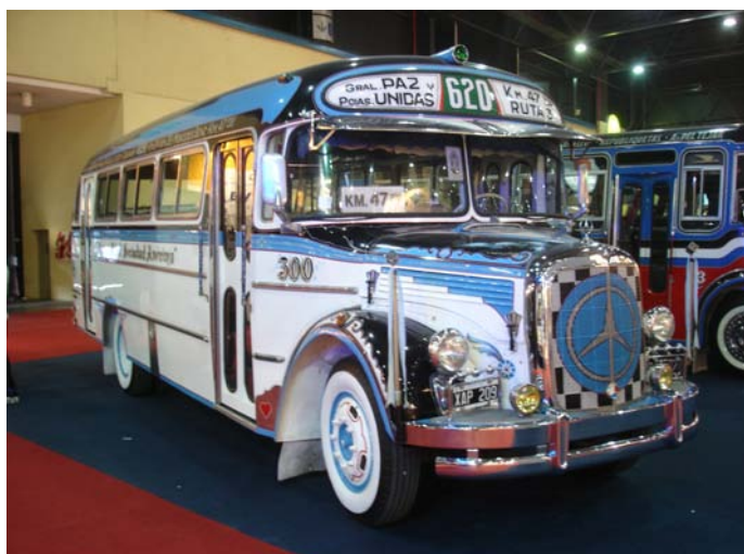
Mercedes Benz LO 911 - Carrocería San Juan - 1968

El stand con más color sin lugar a dudas fue donde se encontraban 3 colectivos totalmente restaurados pertenecientes a las líneas 12, 110 y 620.