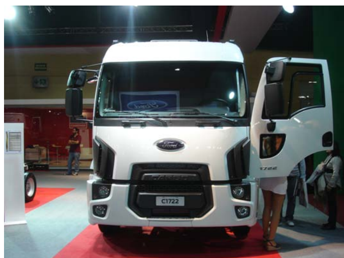
El modelo Cargo 1722