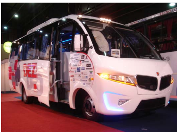
Una vista del modelo Dezeo. El mismo posee una pantalla LCD abatible en su interior.

Con un stand pequeño, logró presentar dos unidades. El minibus Dezeo que posee varias versiones (Urbano Classic, Turismo Plus / Advance y Ejecutivo Luxury). Posee un diseño moderno.