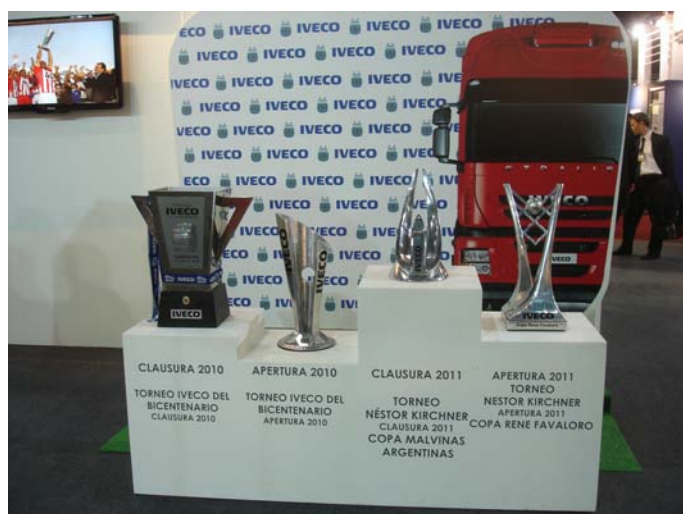
Como patrocinador de los Torneos de futbol Argentino, Iveco presentó las diferentes Copas entregadas.

RENAULT TRUCK presentó su gama Premium Lander y Kerax con motorización Euro 5 y el Renault 440 Special Edition. También montó 2 simuladores de camiones de carrera.