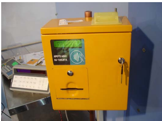
Una vista del modelo TDX 50 MT con opción de pago con monedas o tarjeta.