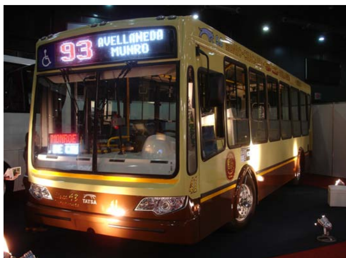
El Puma D9.8 con los colores de la Línea 93 y el interno 41 ya colocados

Con un stand más pequeño que el de 2009, TATSA expuso 2 colectivos y una camión modelo D120 de origen checo y ensamblado en Uruguay con motor Cummins de 170 hp hecho en Brasil.