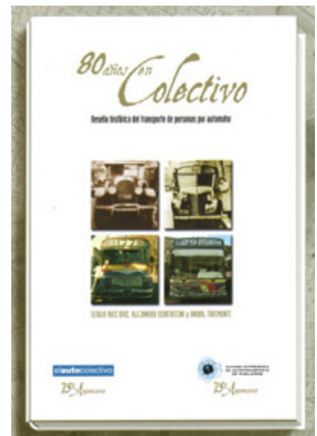
Una vista del Stand y de la tapa del Libro "80 Años en Colectivo"

Posteriormente la Federación de Líneas cambió de nombre. Primero pasó a ser Asociación De Componentes De Las Líneas De Autos Colectivos; luego Asociación De Componentes De Líneas De Colectivos De La Capital Federal, fusionada con absorción de la Asociación De Sociedades Autónomas Del Automotor, el 2 de Noviembre de 1959. Finalmente, a partir del 14 de Noviembre de 1969, pasó a llamarse Cámara Empresaria De Auto-transporte De Pasajeros (C.E.A.P.)