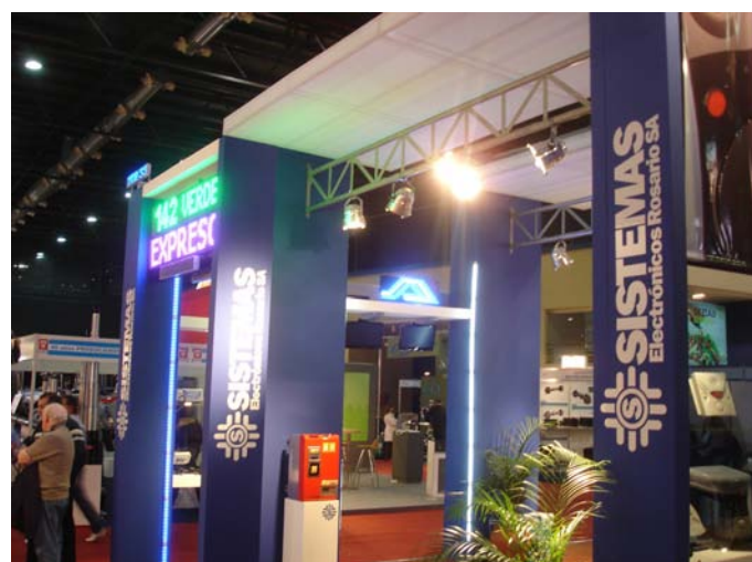
Uno de los stands más coloridos e iluminados de la exposición.

Agradecemos a las personas encargadas de cada stand por su atención. Muchas gracias!!! 🚌