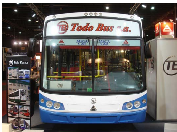
El frente del modelo MT 17.0 LE carrozado por TodoBus

El Todobus MT 17.0 LE, la versión más larga del MT 15.0 se presentó en Expotransporte con los colores de la Línea 21. La unidad incluía asientos GIA y luminarias interiores LED.