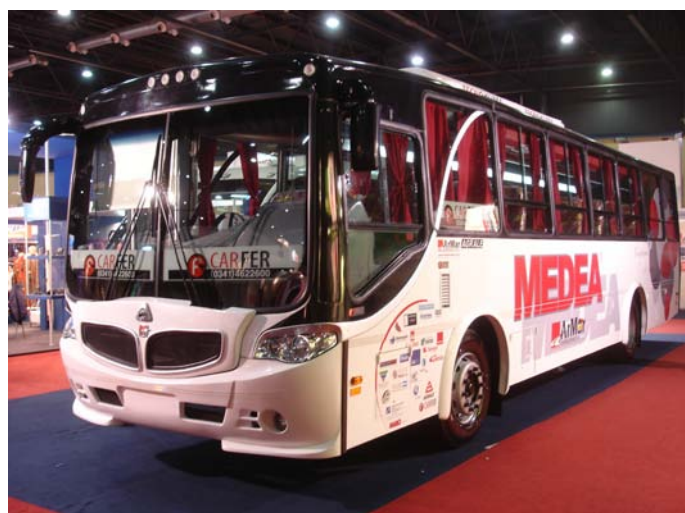
La parrilla dividida del Medea y Dezeo nos recuerda a los modelos de BMW