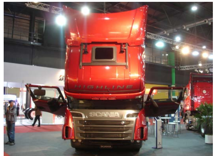
La estrella del stand fue el modelo 580 V8 Highline que fue presentado con su cabina rebatida para dejar al descubierto su potente motor.