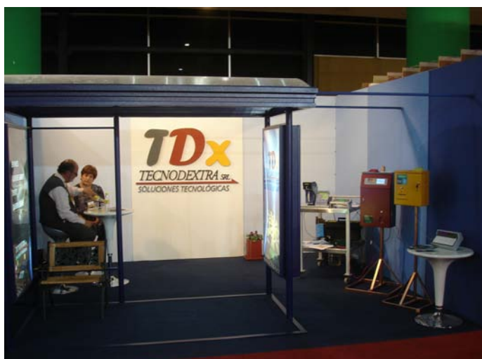
El Stand de TDX presentaba un modelo de parada inteligente y sus diferentes productos (máquinas expendedoras)

En el rubro de fabricantes de máquinas expendedoras, TDX presentó varios de sus modelos con diferentes características. Se destacaba el modelo que posee lector de billetes.