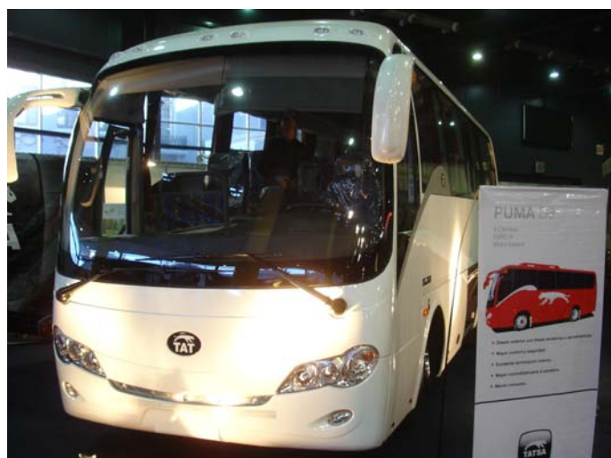
El Puma D8 posee un diseño moderno