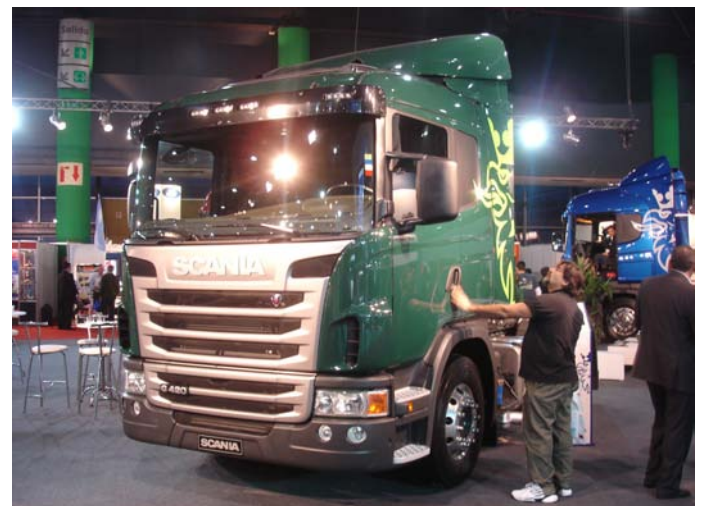
El modelo G 420

Agradecemos la atención en el stand y la folletería entregada con especificaciones de los productos. 🚚