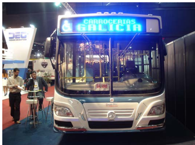
El frente de la unidad, quizás por las ópticas utilizadas, se asemeja a los modelos de Italtub.