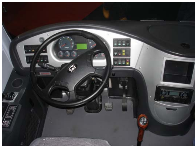
El interior del Puma D8

El modelo de turismo D8 posee el respaldo de una empresa internacional que se llama King-Long que es la segunda empresa fabricante del mundo de autobuses.