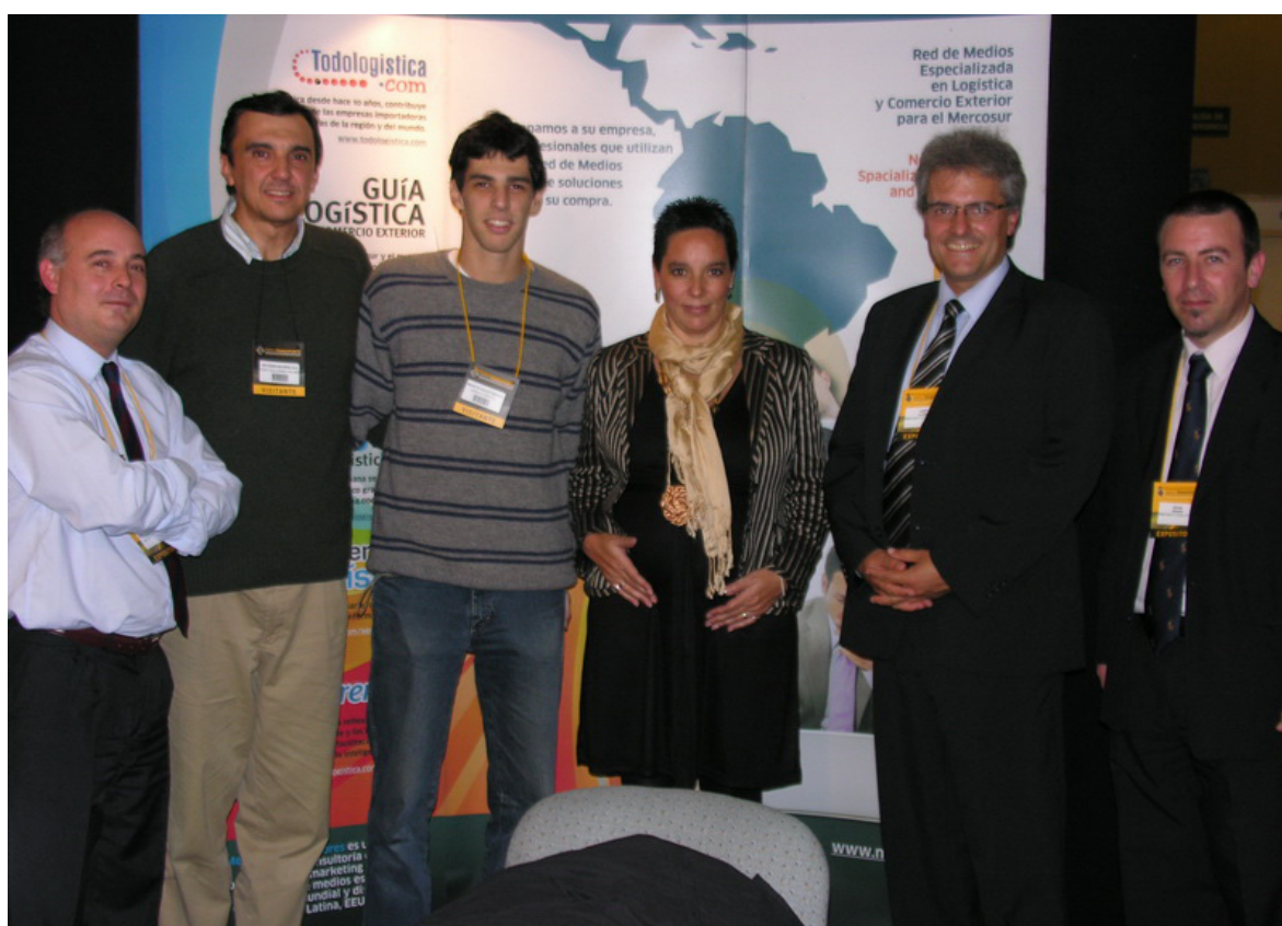
Revista Colectibondi junto al “equipo logístico” que compone Mercosoft Consultores.

La actividad de Mercosoft Consultores vinculada al sector de la Logística y del Comercio Exterior, comienza en el año 1999 con la creación de Todologistica.com., primer portal temático nacido en Uruguay y uno de los primeros a nivel regional orientado a difundir y posicionar la actividad logística y del comercio internacional.