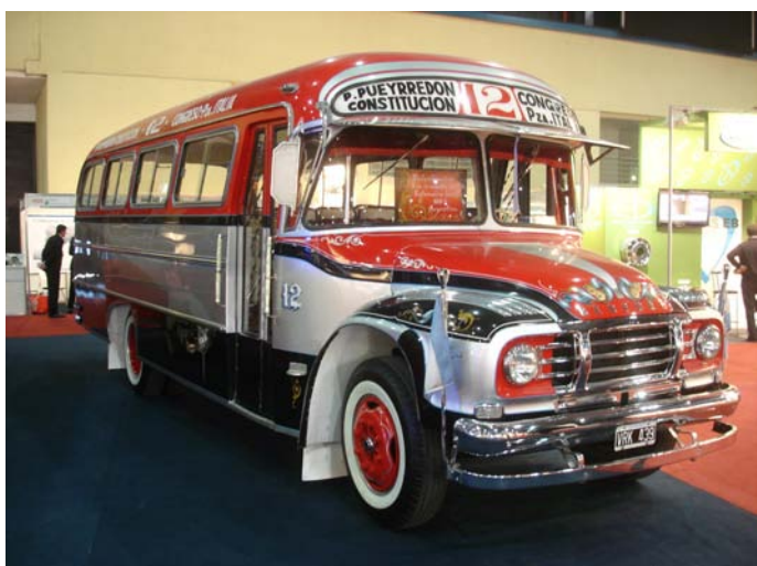
Bedford - Carrocería el Detalle - 1965