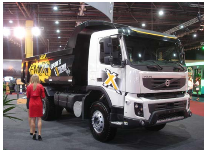
El Volvo FMX 440 ideal para el trabajo en canteras.

Agradecemos la atención en ambos stands y la folletería entregada con especificaciones de los productos. 🚚