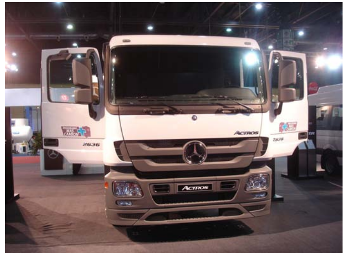
El modelo Actros 2636

VOLVO presentó su gama FH, el FM y el FMX.