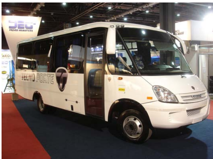
Sus ventanas no poseen burletes a la vista y su puerta es totalmente de vidrio lo que le aporta una buena cuota de diseño

Sobre chasis Iveco Daily 70C16 con capacidad para 15 /28 pasajeros según configuraciones, Tecnoporte presentó su nuevo minibus. El mismo posee una puerta de ascenso totalmente vidriada.