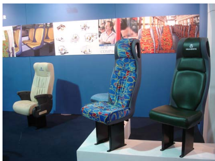
Grammer presentó sus novedades: Asientos con respaldo alto para colectivos urbanos llamados "Compact Tall Lujo"

GIA por su parte, se presentó con un stand mucho más pequeño. Sus productos se pudieron observar instalados dentro de la unidad presentada por la Carrocería TodoBus.