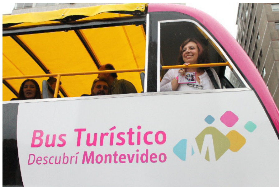
Ana Olivera, la intendenta de Montevideo, arriba de uno de los 3 buses turísticos.

Los tres buses color fucsia, de 4 metros de alto, ya están causando impacto por su estética e imponentia. Las carrocerías son de doble piso, con amplios ventanales vidriados de seguridad y techo superior descapotable, con capacidad total para 60 pasajeros. Cuentan con rampa de accesibilidad universal para personas con dificultad y con lugares especiales hasta para dos sillas de ruedas.