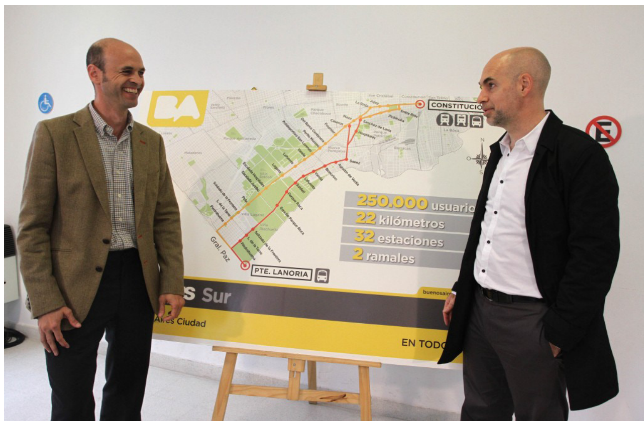
Dietrich y Larreta presentando el mapa del recorrido del Metrobus Sur

A las líneas las utilizan 150.000 pasajeros por día, aunque si se cuenta también a los ocasionales se llega a 250.000 personas. Si el servicio funciona bien, podría sumarse un 30% de usuarios.