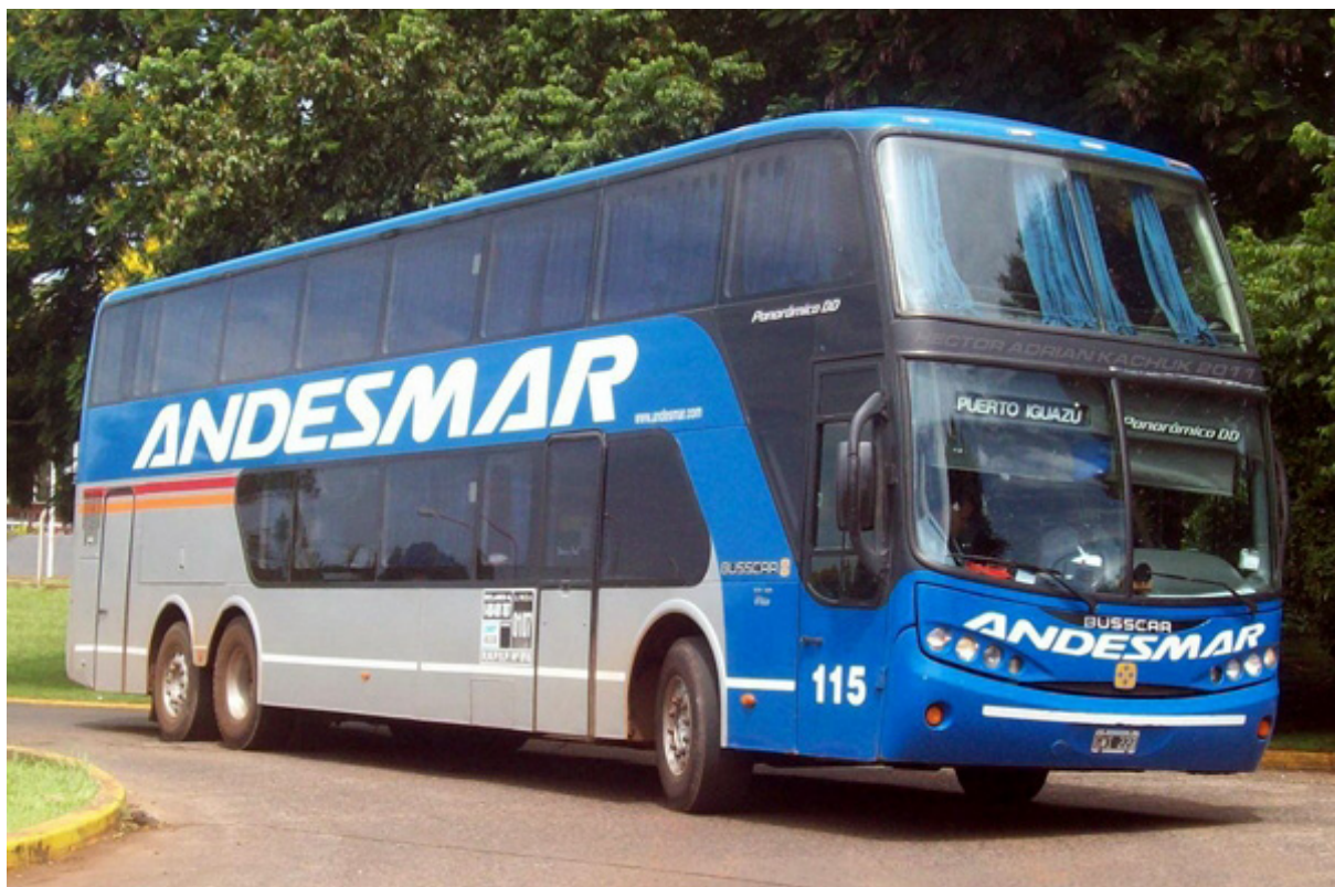
Andesmar se suma a los fabricantes locales de carrocerías

De este modo, la empresa mendocina Andesmar se hará cargo de la logística de este proyecto que contempla la creación de 300 nuevos empleos.