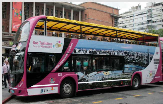
Metalsur Starbus Cabriolet Mercedes Benz

En esta edición, les presentamos dos unidades muy similares de colectivos turísticos.