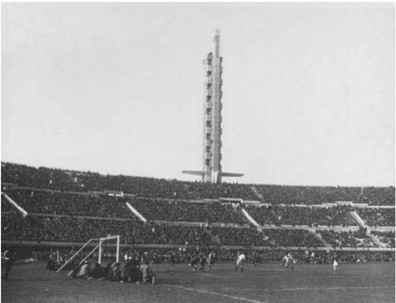
El Estadio Centenario, donde se jugó la final de la Primer Copa del Mundo en 1930, será una de las paradas del Bus Turístico.

La frecuencia de pasada de los buses es de 1 hora entre cada uno; se detendrán 2 minutos en cada parada.