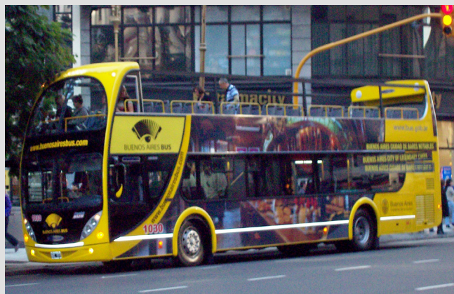
Metalsur Starbus Cabriolet Mercedes Benz