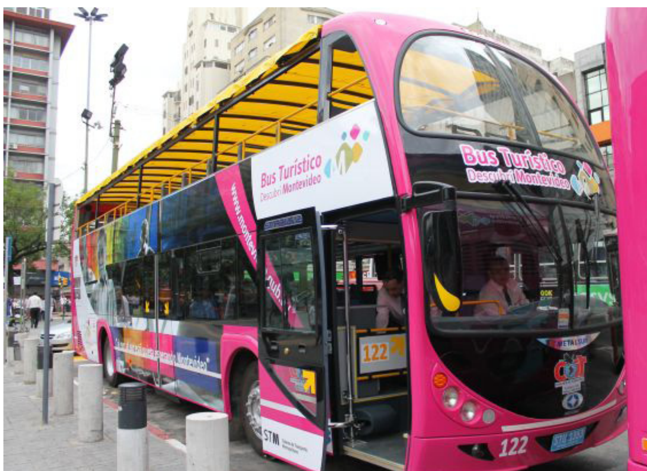
Las 3 unidades que circularán son fabricadas por Metalsur en su modelo Starbus Cabriolet

En su interior, los pasajeros dispondrán auriculares con 8 canales de audio en varios idiomas: español, portugués, inglés, francés, italiano, alemán, y japonés. También se cuenta con pantallas planas de alta definición que, mediante un sistema de GPS, automáticamente desplegarán las imágenes y el audio correspondientes a ese punto de interés turístico en particular. En la planta baja, asimismo, se podrá disfrutar de aire acondicionado frío – calor.