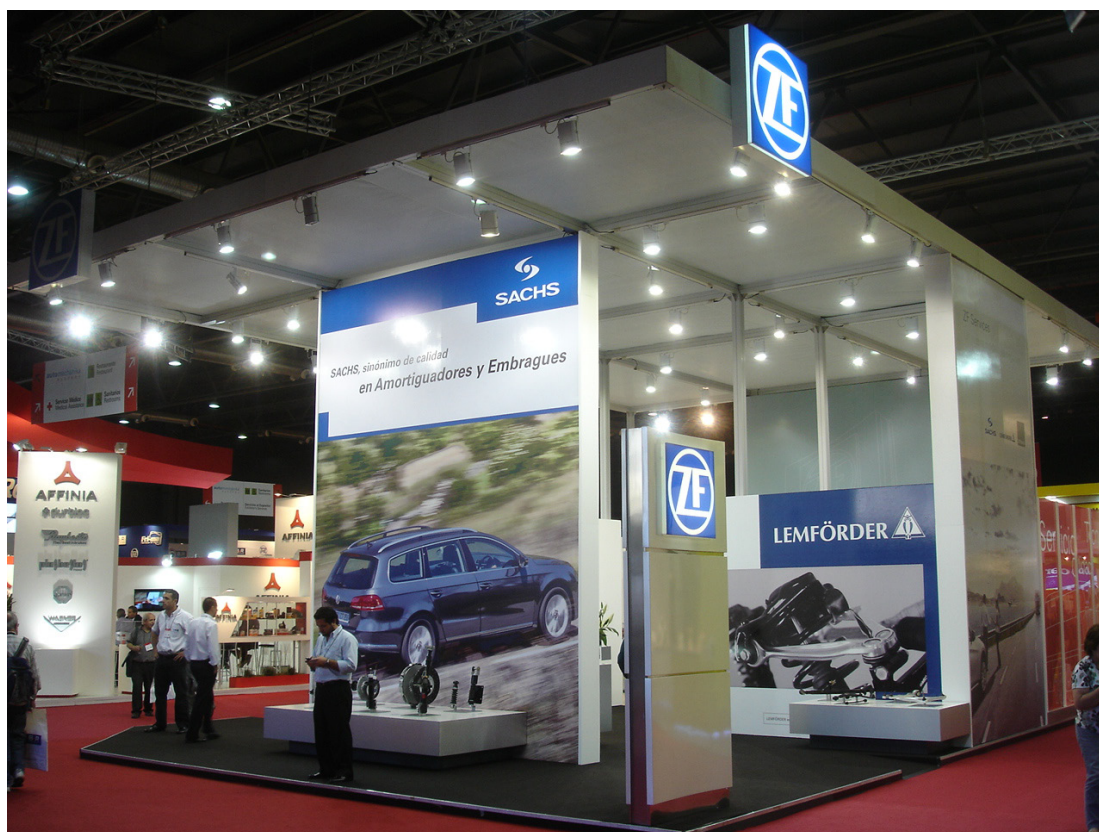
El Stand de ZF estuvo muy bien presentado

Entre las empresas del Pabellón 4 (destinado a las marcas y empresas Chinas), encontramos a Fengcheng Pacific Shenlong Turbocharger Co. Ltd., empresa que se dedica a la comercialización de turbos, la cual estuvo presente en Expotransporte 2012, también realizada en La Rural.