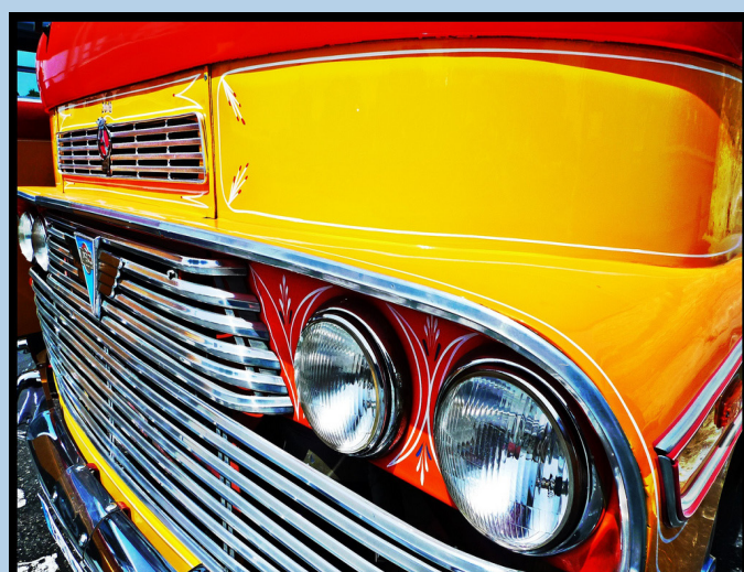
Autobús de Malta

http://www.flickr.com/photos/martin65/8343751824/